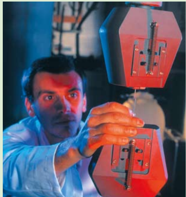
Inovativni ekosistemi – sodelovanje in izmenjava najboljših praks prispevata h konkurenčnosti.

Zato mora Evropski parlament vztrajati pri zahtevi po objavi bele knjige o teritorialni koheziji, ko bo Komisija končala posvetovalni postopek. Samo tako se bo „teritorialna kohezija“ lahko prenesla v konkretne predpise, ki bi jih bilo treba vključiti v naslednji zakonodajni paket o strukturnih skladih za programsko obdobje po letu 2013. Prepričan sem, da bo Evropski parlament zaščitil teritorialno razsežnost naših politik bolj kot v preteklosti. To bo pristop za celoten evropski prostor, ne samo za revnejše regije!