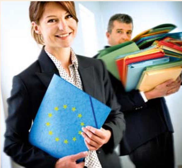
■ EZTS – odpravljanje ovir za čezmejno sodelovanje.

„Bistvo teritorialne kohezije je prilagajanje trenutnim razmeram in izzivom. Je evropski model za trajnostno rast in zaposlovanje,“ je povedala Danuta Hübner, komisarska za regionalno politiko, ob začetku razprave o prihodnosti kohezijske politike.