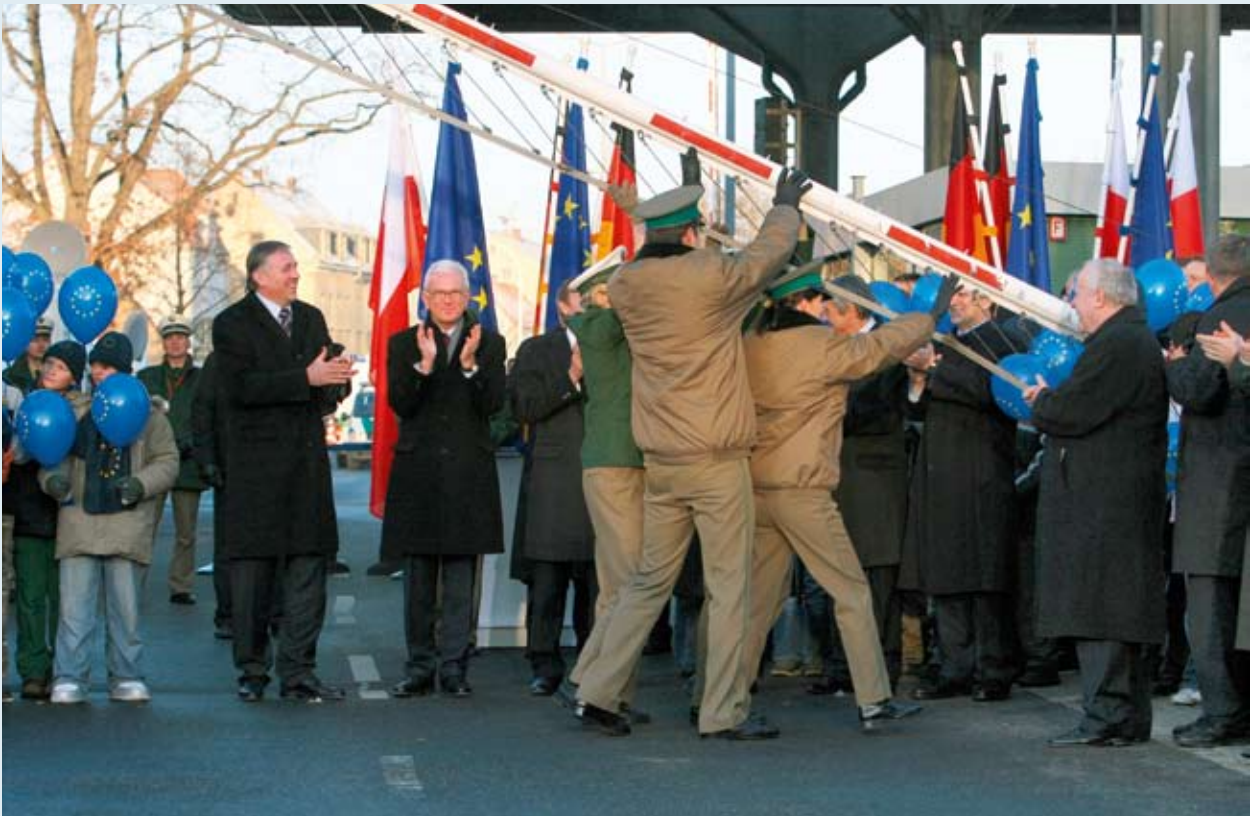
Meje niso ovira za teritorialno kohezijo.

Čeprav Lizbonska pogodba, v kateri je zajet pojem teritorialna kohezija, še ni ratificirana, se je na konferenci izkazalo, da je odziv na to temo velik ter da različnih mnenj in skrbi ni malo: kako zelo bo teritorialno sodelovanje vplivalo na pristojnost držav članic? Če naj se pri načrtovanju vseh politik na vseh ravneh upoštevajo teritorialna kohezija in značilnosti posameznih ozemelj, kako to dejansko storiti? „Krajevna podlaga“, „boljši kazalniki“, „natančnejši ogled zemljevida“, „skladi naj ne veljajo za prvo pomoč“, „sodelovanje in konkurenčnost z roko v roki“: ta tema bo nedvomno še v središču številnih razprav, čas za zeleno knjigo Komisije in javno posvetovanje o njej pa je pravi.