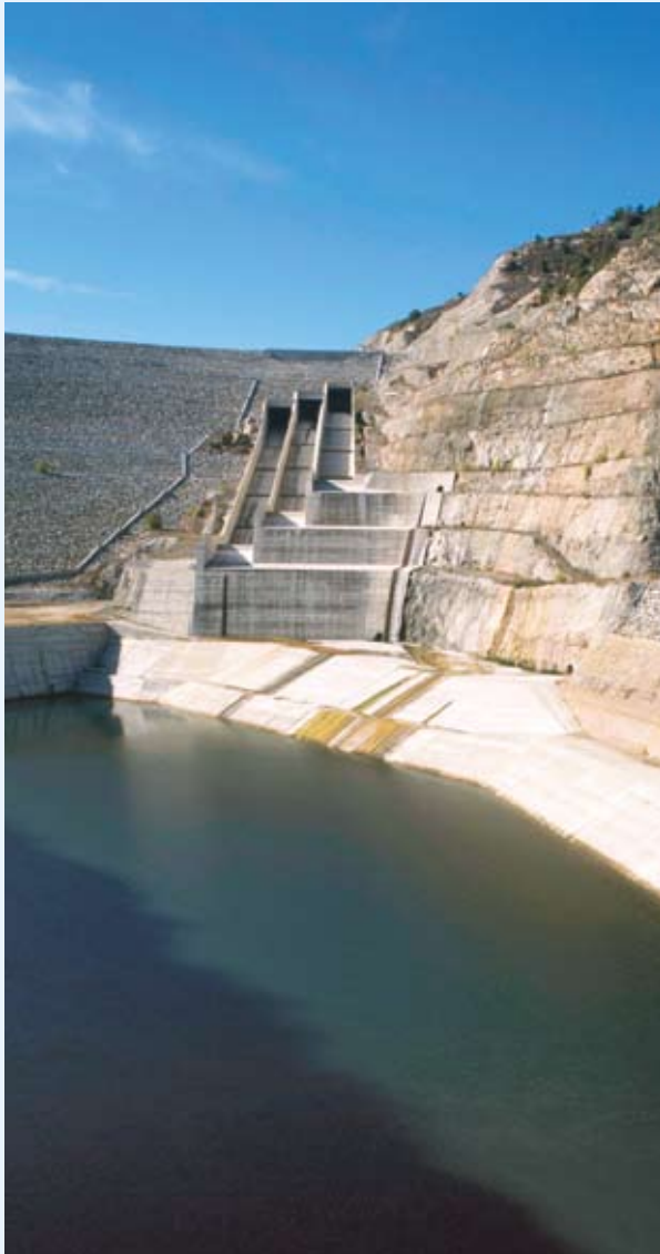
Kohezijska politika – spreminjanje teritorialnih izzivov v prednosti.