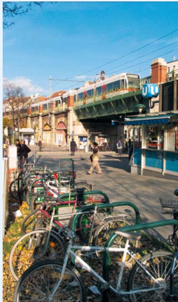
Treba je spodbujati gospodarske koristi koncentracije in hkrati ohraniti pozitivne vidike evropskih mest in velemest.

Kako lahko na ozemlju, za katero je značilno veliko majhnih in srednje velikih mest, dosežemo prednosti zgoščene gospodarske dejavnosti in se hkrati izognemo negativnim stranem, kot so onesaženost, preobremenjenost, propadanje mestnih predelov in socialna izključenost? Odgovor je spodbujanje sodelovanja, interakcije in povezovanja med mesti, velemesti in okoliškim podeželjem. Da bi Evropa izkoristila dvig produktivnosti, ki ga prinaša zgoščevanje gospodarske