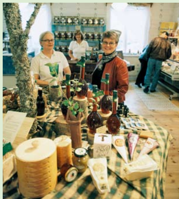
Evropska družina – raznolikost vsake regije prispeva k skupni moči Evrope.

V Lizbonski pogodbi je pojem javnih služb jasno povezan s teritorialno kohezijo, kar je tudi bistveni vidik vzpostavitve teritorialne kohezije. Vzemimo na primer direktivo o poštnih storitvah. Prepričan sem, da tega besedila ne bi mogli uporabiti, če bi ga predložili v predhodno preučitev ob upoštevanju potreb politike teritorialne kohezije, ker jim ne ustreza. Javne službe so razsežnost, ki jo je treba prilagoditi pojmu teritorialna kohezija. To bi Evropo lahko spodbudilo k reviziji številnih zadev, povezanih z javnimi službami. Želel bi si, da bi zelena knjiga to precej bolj poudarila.