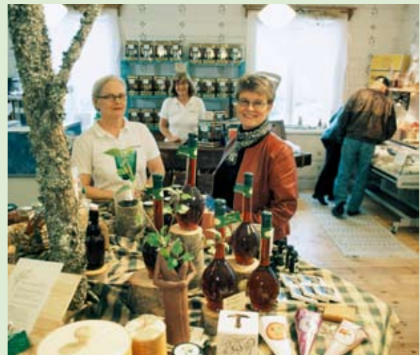
■ Európa legfőbb erejét régióinak sokfélesége adja.

A lisszaboni szerződés a közszolgáltatások fogalmát egyértelműen összefüggésbe hozza a területi kohézióval. Ez a területi kohézió kialakításának egyik alapvető aspektusa. Vegyük például a postai szolgáltatásokra vonatkozó irányelvet. Biztos vagyok benne, hogy ha ennek szövegét a területi kohéziós politika kívánalmái szempontjából előzetes vizsgálatnak vetettük volna alá, nem használhattuk volna a jelenlegi formájában, hiszen nem felel meg a területi kohéziós politika igényeinek. A közszolgáltatások dimenzióját feltétlenül be kellene építeni a területi kohézió fogalmába. Ez arra ösztönözhetné Európát, hogy a közszolgáltatásokkal kapcsolatban bizonyos dolgokat felülvizsgáljon. Szerettem volna, ha a zöld könyv sokkal nagyobb hangsúlyt helyez erre az aspektusra.