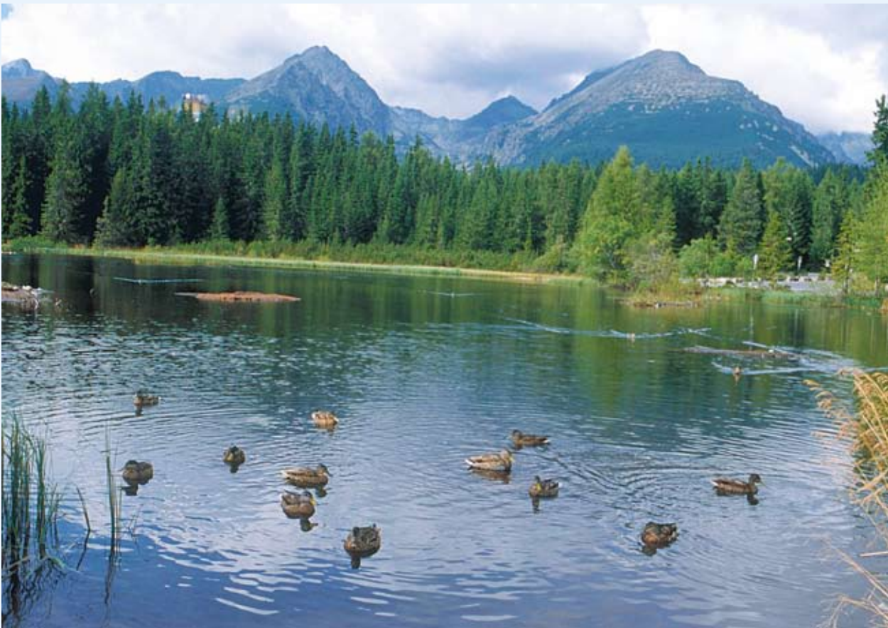
Az olyan földrajzi képződmények, mint pl. a hegyvonulatok, sokszor megkérdőjelezzik a határokról alkotott korábbi fogalmunkat.