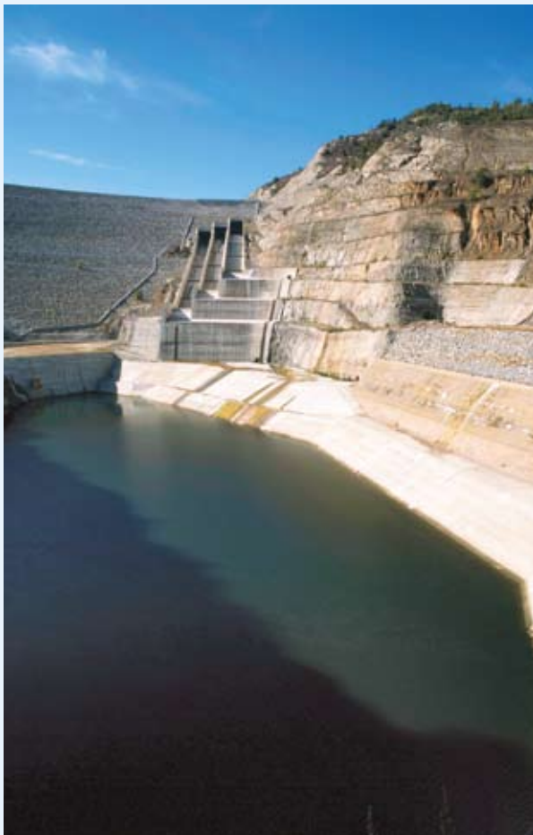
Kohéziós politika – fordítsuk előnyünkre az előttünk álló kihívásokat.