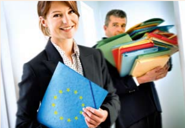
Az EGTC-vel egyszerűbbé válik a határokon átnyúló együttműködés.

„A területi kohézió lényege a mai valósághoz és kihívásokhoz való alkalmazkodás. Ez a fenntartható növekedés és fenntartható munkahelyek európai modellje” – mondta Danuta Hübner, a regionális politikáért felelős biztos, amikor megnyitotta a kohéziós politika jövőjéről folytatandó vitát.