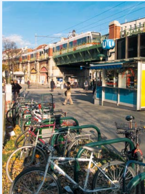
A koncentrációból fakadó gazdasági előnyöket úgy kellene fokozni, hogy közben sikerüljön megőrizni az európai városok pozitívumait.

Hogyan lehet egy olyan területen, amelyre inkább a kis és közepes méretű városok sokasága jellemző, úgy kihasználni