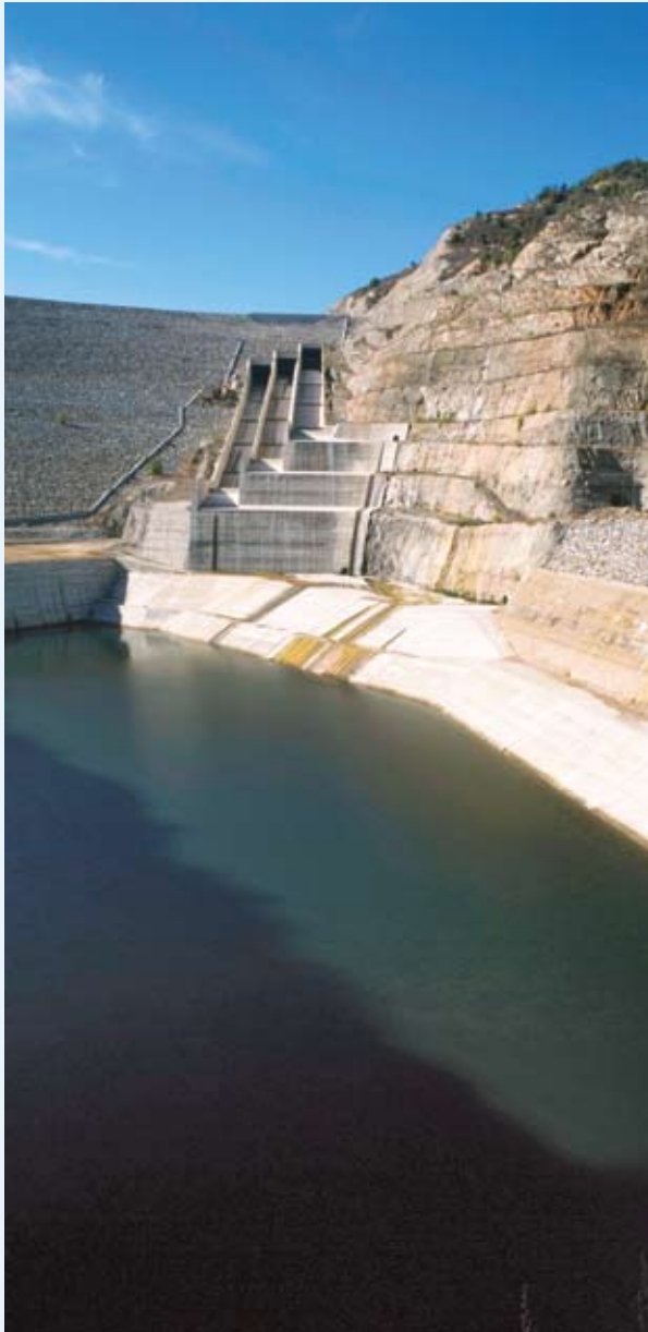
Politika soudržnosti – profitování z územních řešení.