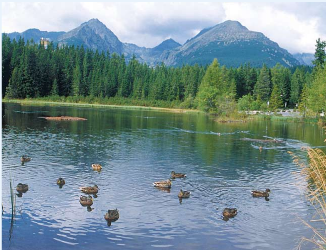
Geografická měřítka, jako například pohoří, mění naše dřívější představy o hranicích.