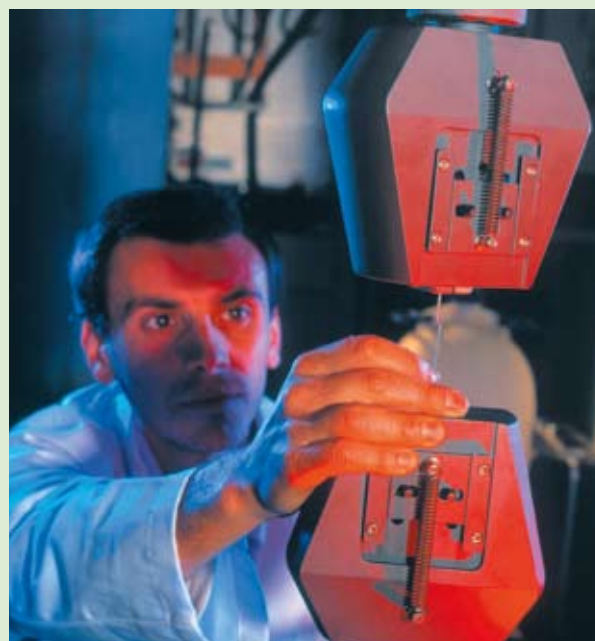
Новаторските екосистеми, сътрудничеството и обмяната на най-добър опит спомагат за засилване на конкурентоспособността.

Следователно, Европейският парламент трябва твърдо да стои зад искането за публикуване на Бяла книга за териториално сближаване след приключване на консултативния процес на Комисията. Само това ще проправи път за превеждане на „териториалното сближаване“ в конкретни положения, които трябва да бъдат представени в следващия законодателен пакет по структурните фондове за програмния период след 2013 г. Вярвам, че Европейският парламент ще съхрани териториалните измерения на нашите политики по един много по-решителен начин. Това ще бъде подход за цялата Европейска зона, не само за по-бедните региони.