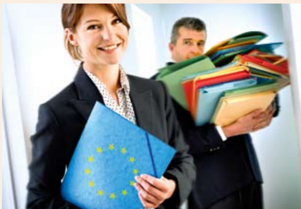
ЕГТС – облекчаване на сложността на трансграничното сътрудничество.

„Териториалното сближаване означава адаптиране към съвременните реалности и предизвикателства. Това е един европейски модел за устойчив ръст и работни места“ обяснява Данута Хюбнер - комисар по Регионална политика, стартирайки дебата за бъдещето на политиката на сближаване.