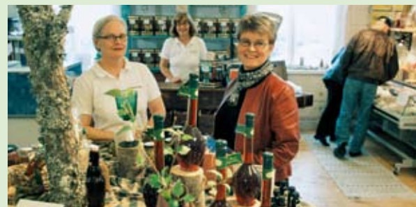
Европейският Концерт – разнообразието на всеки един регион е общата сила на Европа.

Лисабонският договор ясно свързва представата за обществените услуги с териториалното сближаване, което е фундаментален аспект в изграждането на териториалното сближаване. Например, да разгледаме директивата за почтенските услуги. Сигурен съм, че ако бяхме представили теста за преглед предварително, по отношение на нуждите на политиката на териториалното сближаване, нямаше да можем да използваме същия текст, тъй като той не отговаря на нуждите на териториалното сближаване. Обществените услуги са измерение, което трябва да се приложи отново към концепцията за териториалното сближаване. Това може да подкани Европа да преразгледа редица неща, свързани с обществените услуги. Щеше ми се Зелената книга да беше отделила повече внимание на това.