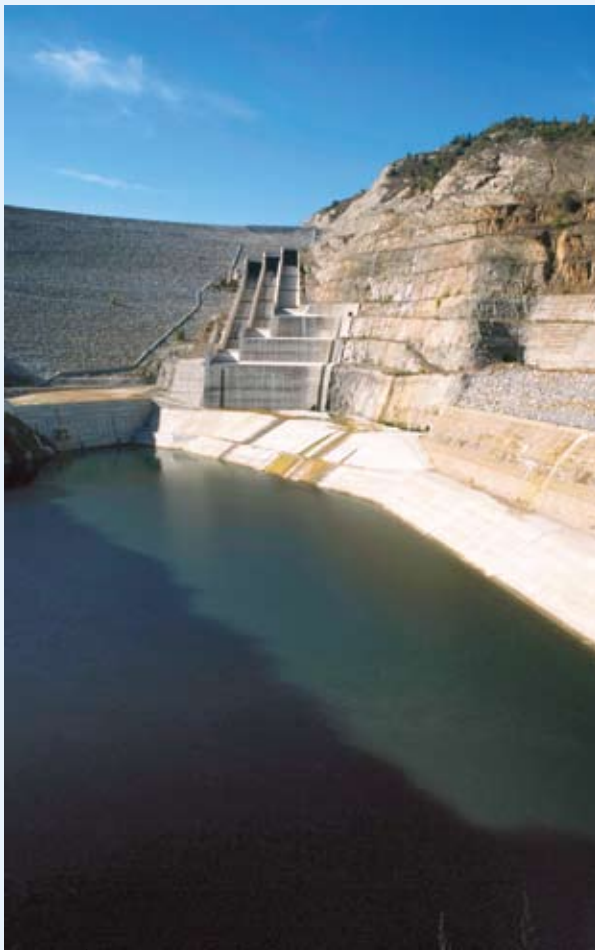
Политиката на сближаване - превръща териториалните предизвикателства в активи.