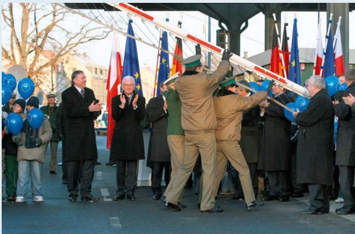
Границите не са препятствие за Териториалното Сближаване.

Въпреки че Лисабонският договор, в който е заложена идеята за териториално сближаване, не е ратифициран, конференцията изясни, че темата е силно коментирана, като не липсват мнения и без недостиг на мнения и опасения: колко дълбоко ще навлезе териториалното сътрудничество в правомощията на страните членки? Ако териториалното сближаване и оценяването на индивидуалните характеристики на териториите трябва да се вземат под внимание в планирането на всяка политика на всяко ниво, как ще стане това на практика? „базирана на място“, „по-добри индикатори“, „по-близък поглед към картата“, „фондовете да не се разглеждат като пакет за първа помощ“, „сътрудничество и конкуренция ръка за ръка“: Няма съмнение, че темата ще бъде в центъра на още много дебати и Зелената книга на комисията и последващите обществени консултации са навременни.