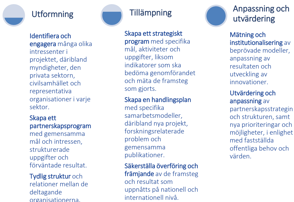
Figur 1 Logisk samarbetsram mellan utbildningsväsendet och näringslivet