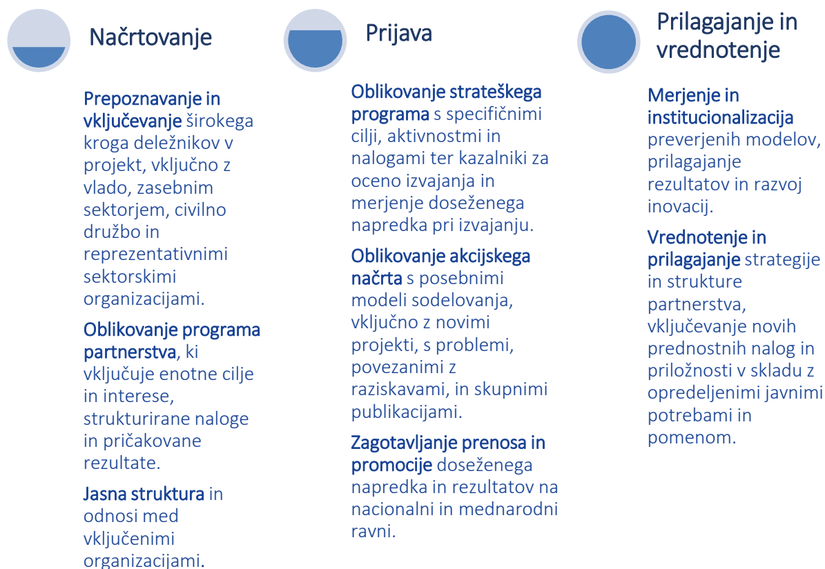
Slika 1 Logični okvir za sodelovanje med akademskimi krogi in industrijo