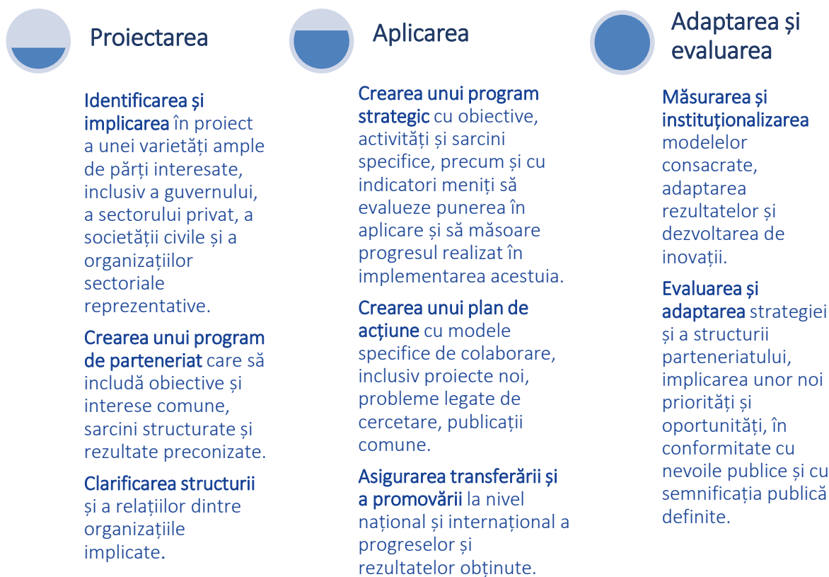
Figura 1 Cadru logic de colaborare între mediul academic și industrie