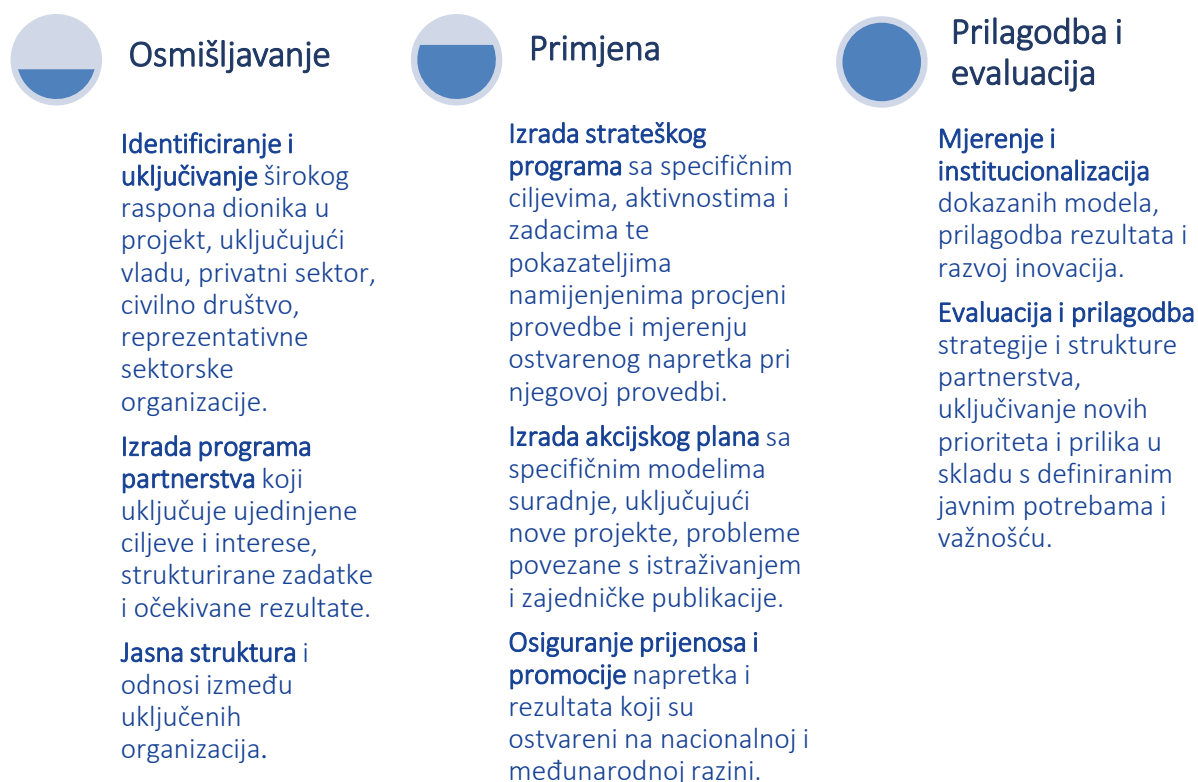
Slika 1 Logički okvir za suradnju akademske zajednice i industrije