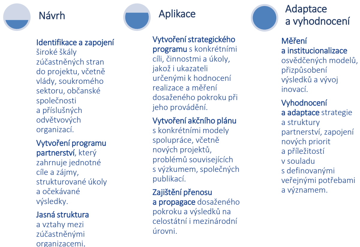
Obrázek 1 Logický rámeček spolupráce mezi akademickou obcí a průmyslem