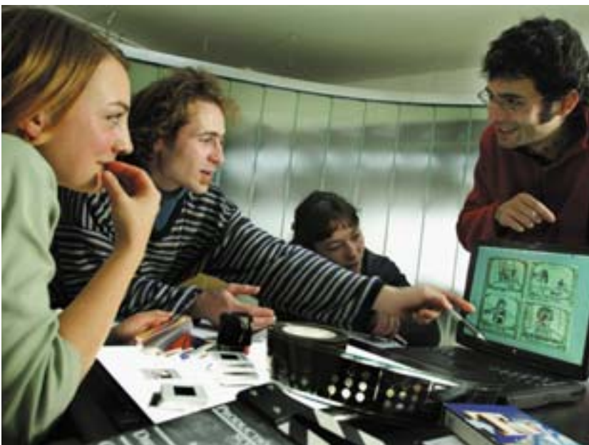
ESFi poolt toetatud erialane ettevalmistus.