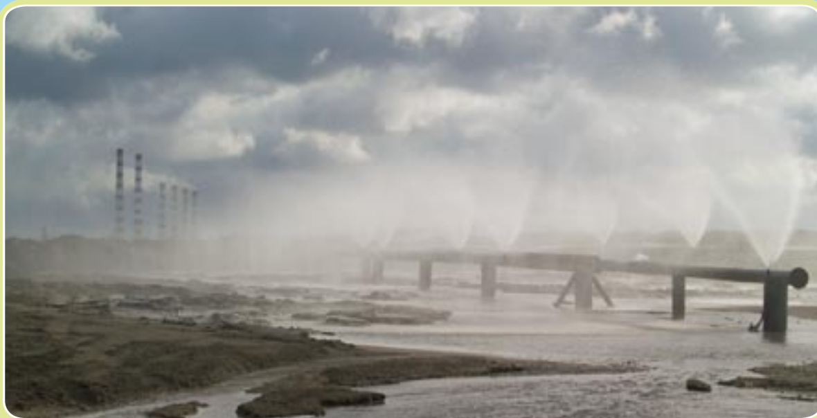
Tööstuse puhtamaks muutmise keskkonna kaitsmiseks

Veebileht: www.powerplant.ee/uf_project.php