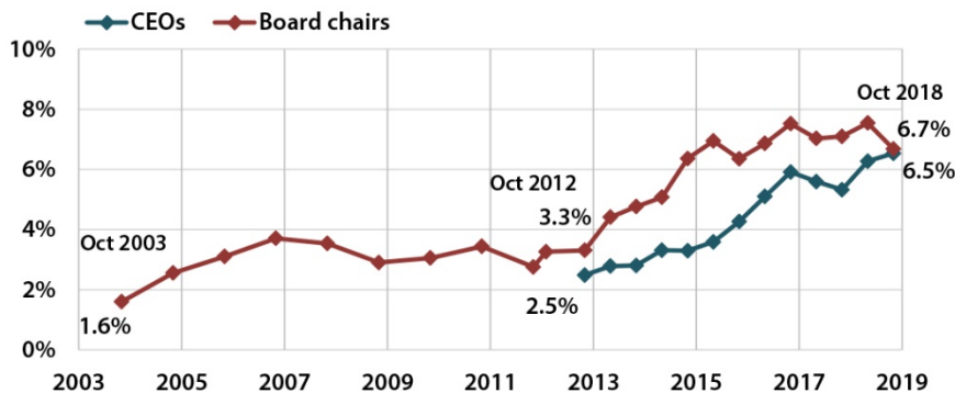
Rysunek 3: Odsetek kobiet i mężczyzn wśród prezesów i dyrektorów generalnych największych spółek notowanych na giełdzie w UE w latach 2003–2018 r.