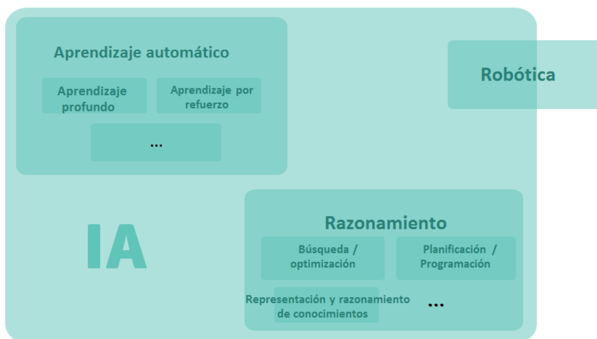
Ilustración 2: Descripción general simplificada de las subdisciplinas de la IA y de la relación existente entre ellas.

La ilustración 2 muestra la mayoría de las subdisciplinas mencionadas anteriormente, así como la relación que existe entre ellas. Es importante, sin embargo, tener en cuenta que la IA es un campo mucho más complejo de lo que refleja esta ilustración, puesto que incluye muchas otras subdisciplinas y técnicas. Además, como ya se ha indicado, la robótica también se apoya en técnicas ajenas al espacio de la IA. Entendemos, no obstante, que esta representación es suficiente para mostrar de manera adecuada el tipo de intercambio de opiniones, concienciación y debate sobre IA, ética de la IA y políticas relativas a la IA que es necesario acometer en el seno del propio grupo de expertos de alto nivel, un grupo multidisciplinar formado por múltiples partes interesadas.