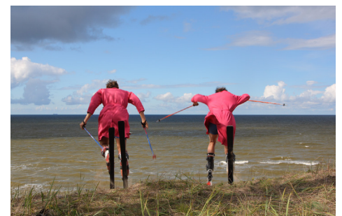
► Picas / Pizzas