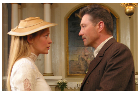
► Rīgas sargi / Defenders of Riga