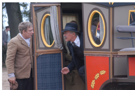
► Rūdolfas mantojums / Rudolf's Gold