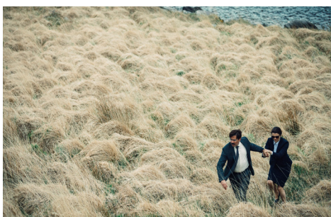
▶ The Lobster

Τριλογία: Το Λιβάδι που δακρύζει (2004) Βραβείο FIPRESCI – Ευρωπαϊκή Ακαδημία Κινηματογράφου