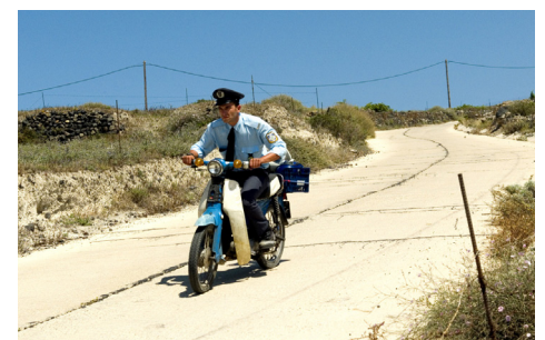
▶ Μικρό Έγκλημα / Small Crime