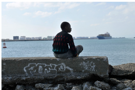
► Le Havre