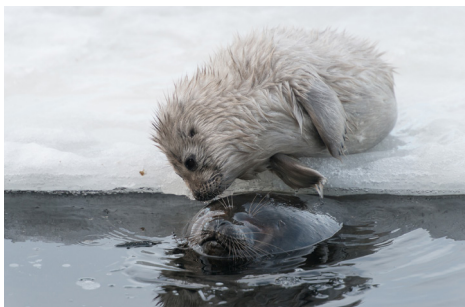
► Järven tarina / Tale of a Lake

► Iron Sky tunnetaan maailmanlaajuisesti urauurtavasta tavasta rahoittaa ja markkinoida elokuvaa. Elokuvantekijät rakensivat vuosien ajan ennen elokuvan valmistumista elokuvalle vahvan fanijoukon, joka osallistui myös joukkorahoituksen kautta elokuvan rahoittamiseen. Iron Sky -elokuvan tekijät ovat todellisia joukkorahoituksen ja sosiaalista mediaa hyödyntävän markkinoinnin uranuurtajia. Heillä on nyt tekeillä elokuvan jatko-osa Iron Sky The Coming Race (ensi-ilta 2017). Myös tulevassa elokuvassa fanit ovat olleet alusta asti mukana suurella panoksella. Iron Sky tehtiin Suomi-Saksa-Australia-yhteistuotantona. Se sai 50 000 € MEDIA:n hankekehittelytukea.