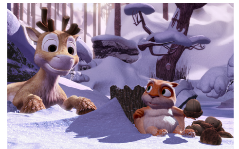
► Niko – Lentäjän poika / Niko & The Way to the Stars

© 2008 Anima Vitae, Cinemaker, Ulysses, A.Film & Magma Films