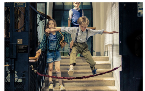
► Supilinna salaselts / Secret Society of Souptown