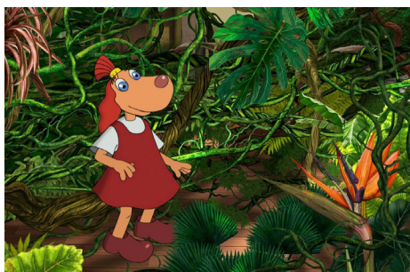
► Lotte ja kuukivi saladus / Lotte and the Moonstone Secret