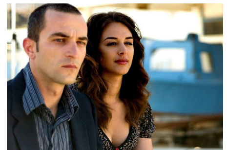
▶ Μικρό Έγκλημα/ Small Crime