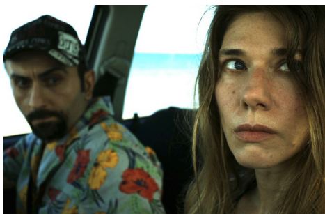
▶ Fish n' Chips

▶ Η εταιρεία παραγωγής LYCHNARI ήταν ακόμη ένα παράδειγμα Κυπριακής εταιρείας που αντιμετώπιζε μεγάλη δυσκολία στη χρηματοδότηση και που απευθύνθηκε στο πρόγραμμα MEDIA. Η ταινία μυθοπλασίας Μικρό Έγκλημα / Small Crime μέσα στο πλαίσιο της πρόσκλησης 86/2003 - Ανάπτυξη για Μεμονωμένα Σχέδια έλαβε χορηγία € 40.000. Η ταινία προβλήθηκε σε πολλά διεθνή φεστιβάλ, ενώ πέτυχε συνεργασίες για συμπαραγωγή με Ελλάδα και Γερμανία.