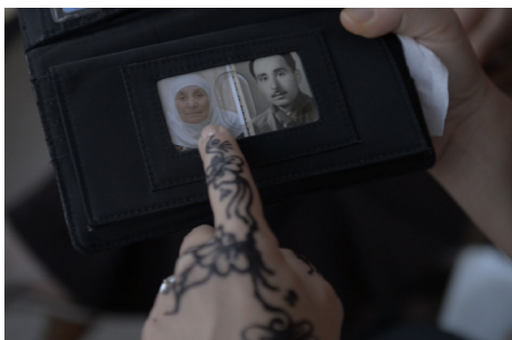
▶ Missing Fetine