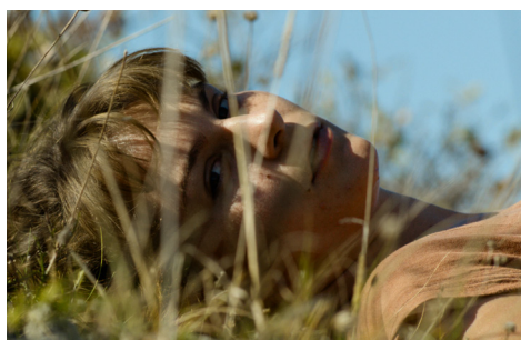
▶ Zvzdán / The High Sun

▶ Film Svećenikova djeca , u režiji poznatoga hrvatskog redatelja Vinka Brešana i u produkciji tvrtke Interfilm d.o.o., ostvario je potporu Programa MEDIA na razini selektivne distribucije. Iako MEDIA nije sudjelovala u njegovoj razvojnoj fazi, omogućila mu je dodanu vrijednost u kontekstu europske, odnosno međunarodne, prepoznatljivosti i gledanosti, „vraćajući” istovremeno hrvatsku publiku u kina. Svakako je bitno istaknuti da su prava za prikazivanje filma prodana u 19 zemalja sudionica Programa MEDIA s ukupnim iznosom od HRK 3 milijuna. Kulminaciju popularnosti filma potvrđuju sljedeće brojke: u kinima diljem svijeta zabilježeno je 113.335 njegovih gledatelja, dok se u hrvatskim kinima broj gledatelja penje na njih 158.000.