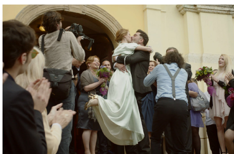
▶ Zivot je truba / Life is a trumpet