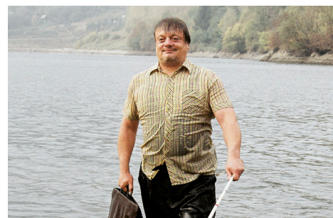
► Slepé lásky / Blind Loves