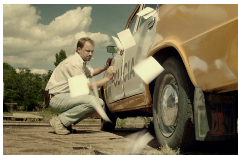
► Červený Kapitán / The Red Captain