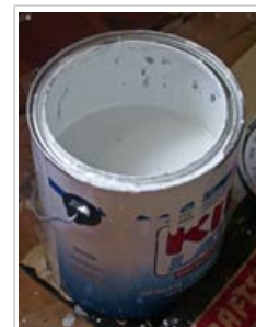
Ciertas pinturas emiten sustancias químicas

Algunos estudios muestran una relación entre el uso de ciertos productos de consumo y efectos adversos para la salud. Sin embargo, no está claro hasta qué punto los contaminantes son responsables de los efectos observados, ya que hay otros factores que pueden contribuir a ellos.