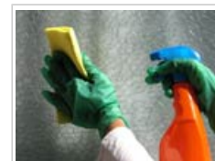
Varios productos de limpieza emiten sustancias químicas

Algunos contaminantes del aire interior proceden del exterior, pero la mayoría se liberan dentro del propio edificio, por ejemplo al limpiar o al quemar combustible para cocinar o producir calor. El mobiliario y los materiales de construcción también pueden emitir contaminantes. La humedad y la falta de ventilación pueden aumentar aún más la contaminación del aire interior.