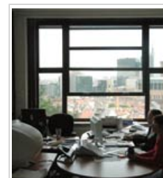
Es necesario determinar cómo están expuestas las personas a los contaminantes del aire interior

9.1 Los datos disponibles para evaluar los riesgos de la contaminación del aire interior son escasos y, a menudo, insuficientes. Existe información sobre el nivel de concentración en el aire interior de algunos contaminantes muy conocidos, pero no sobre otros contaminantes cuyos efectos no están claros. Las medidas de la calidad del aire exterior no pueden extrapolarse para predecir las concentraciones en los edificios.