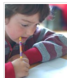
C'est en mâchonnant et en lèchant les gommes que les enfants sont exposés aux phtalates qu'elles contiennent.

L'exposition des enfants au DEHP et au DINP quand ils lèchent ou mâchonnent des gommes dépend du laps de temps durant lequel ils gardent la gomme en bouche, du nombre de petits bouts de gomme qu'ils ont avalés, de la quantité de phtalates qui passe dans la salive ou dans le suc gastrique, ainsi que de la façon dont la substance est absorbée par le corps via la digestion.