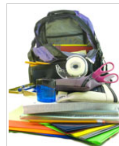
L'Agence danoise pour la protection de l'environnement a révélé la présence de divers phtalates dans les fournitures scolaires

Les phtalates sont un groupe de composés chimiques utilisés dans la production de plastiques tels que les PVC pour rendre ces matières plus souples et flexibles. Les phtalates ne sont pas chimiquement liés au plastique et peuvent dès lors s'échapper des produits de consommation qui en contiennent. Cela peut causer une exposition du public, ce qui a suscité une certaine inquiétude. Il existe de nombreux phtalates différents avec leurs propres propriétés, usages et effets sur la santé.