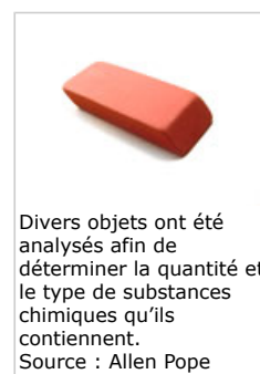
Divers objets ont été analysés afin de déterminer la quantité et le type de substances chimiques qu'ils contiennent.

2.1 Dans le cadre de l'étude menée par l'Agence danoise pour la protection de l'environnement, un certain nombre de cartables, sacs à jouets, trousse et gommes disponibles en magasins ont été analysés dans le but de déterminer le type et la quantité de substances chimiques qu'ils contenaient ainsi que la quantité de substances qui serait libérée si les enfants les mordaient ou les léchaient.