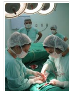
Los biocidas se usan en los hospitales para prevenir y controlar infecciones.

6.4 Los biocidas se utilizan en cantidades tan grandes que están presentes en pequeñas concentraciones en el medio ambiente. Existe la preocupación de que una exposición continua de las bacterias a biocidas podría conducir a la aparición de cepas resistentes, aunque todavía no se ha demostrado en la práctica.