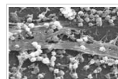
Las bacterias que crecen como un biofilm son capaces de sobrevivir en condiciones hostiles.

8.1 Cada biocida actúa de forma distinta, y unos tienen más probabilidades de provocar la aparición de bacterias resistentes que otros. El riesgo de la propagación de genes resistentes depende del tipo de bacteria