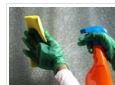
Se utilizan biocidas por ejemplo en los productos de limpieza.

2.2 Los biocidas se añaden a muchos bienes de consumo para evitar que crezcan microorganismos en ellos y los deterioren. Se utilizan en cosméticos y productos de cuidado personal, productos de limpieza, detergentes y desinfectantes.