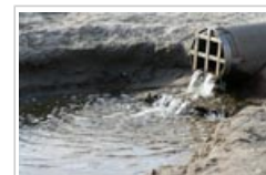
Los biocidas se vierten junto con las aguas residuales.

3.5 Dado que los biocidas se utilizan en grandes cantidades y se vierten junto con las aguas residuales, están presentes en pequeñas concentraciones en el medio ambiente. Existe la preocupación de que dicha situación conduzca a la supervivencia selectiva de las bacterias resistentes.