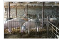
Se utilizan biocidas en ganadería.

2.4 En ganadería , los animales, sus derivados y cualquier recinto y material utilizados suelen tratarse con biocidas para descontaminarlos, para evitar el desarrollo de microorganismos potencialmente dañinos y para proteger a los animales de enfermedades.