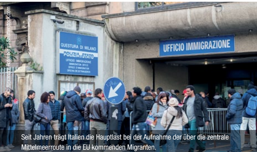
Seit Jahren trägt Italien die Hauptlast bei der Aufnahme der über die zentrale Mittelmeerroute in die EU kommenden Migranten.

Angesichts der stark gestiegenen Zahl von Menschen, die aus Nordafrika über das Mittelmeer nach Italien kommen, sehen sich die italienischen Behörden an der Grenze ihrer Aufnahmefähigkeit. Die EU-Kommission hat einen Aktionsplan vorgelegt, wie Italien unterstützt und die Zahl der Migranten verringert werden kann. Dieser wurde von den EU-Innenministern begrüßt und bestätigt. Die Italiener hätten Anspruch auf die Solidarität ihrer Partner, sagte Frans Timmermans, der Erste Vizepräsident der EU-Kommission. Denn Italien habe in der Flüchtlingskrise Europa gegenüber „ein Ausmaß an Solidarität bewiesen, das in der neueren Geschichte nahezu beispiellos ist“, so Timmermans.