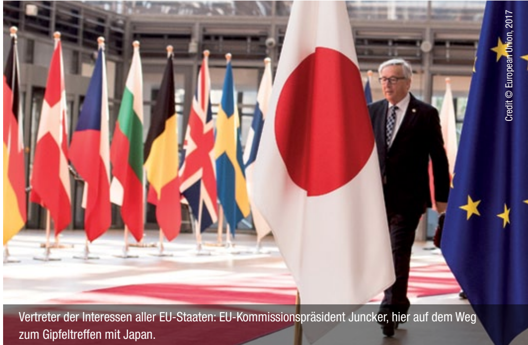
Vertreter der Interessen aller EU-Staaten: EU-Kommissionspräsident Juncker, hier auf dem Weg zum Gipfeltreffen mit Japan.