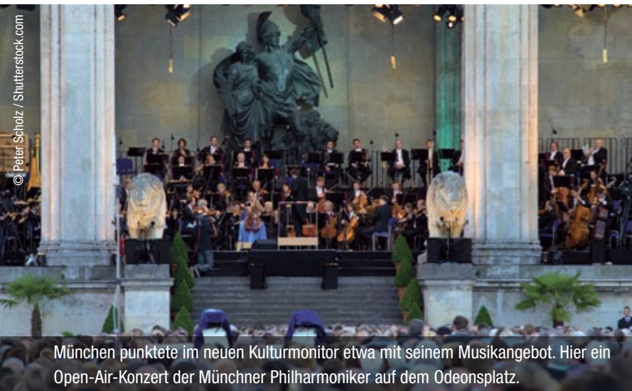
München punktete im neuen Kulturmonitor etwa mit seinem Musikangebot. Hier ein Open-Air-Konzert der Münchner Philharmoniker auf dem Odeonsplatz.

Das kulturelle Leben in einer Stadt und die Kreativität ihrer Einwohner beeinflussen nach Überzeugung der EU-Kommission maßgeblich auch die sozialen Verhältnisse und die Wirtschaftskraft. Kultur und kreative Berufe sollen deshalb in der europäischen Politik eine höhere Bedeutung bekommen. „In Zeiten großer gesellschaftlicher Veränderungen und eines schärferen weltweiten Wettbewerbs zwischen Städten müssen wir über die traditionellen Quellen von Wachstum und sozio-ökonomischen Wohlstands hinausblicken und untersuchen, welche Rolle Kultur in lebendigen, innovativen und vielfältigen Städten spielt“, sagte Tibor Navracsics, der für Bildung, Kultur, Jugend und Sport zuständige EU-Kommissar.