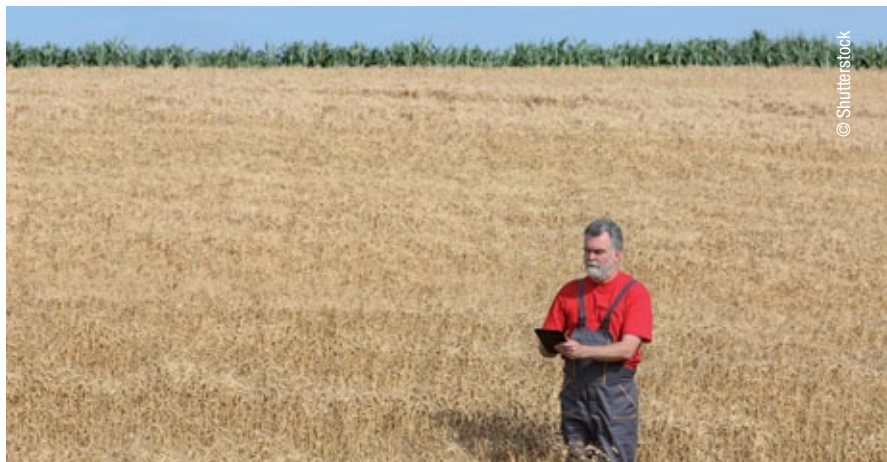
Die EU fördert zum Beispiel die Entwicklung ländlicher Regionen. Etwa durch den Einsatz moderner Technik in der Landwirtschaft.

Wenn nach 2020 die neue mittelfristige Finanzplanungsperiode der EU beginnt, sollen Unternehmen, Forscher, Bürger und die Träger von Projekten, etwa zur regionalen Entwicklung oder der Förderung des sozialen Zusammenhalts, leichter an EU-Fördermittel kommen. Eine 2015 von der EU-Kommission eingesetzte Expertengruppe hat jetzt Vorschläge gemacht, wie das oft unübersichtliche und sich überschneidende europäische und nationale Regelwerk zur Vergabe von EU-Mitteln deutlich vereinfacht werden könnte. Damit könne die EU dafür sorgen, dass ihre oft dringend benötigten, aber begrenzten Fördermittel bestmöglich genutzt werden, betonte EU-Haushaltskommissar Günther Oettinger.