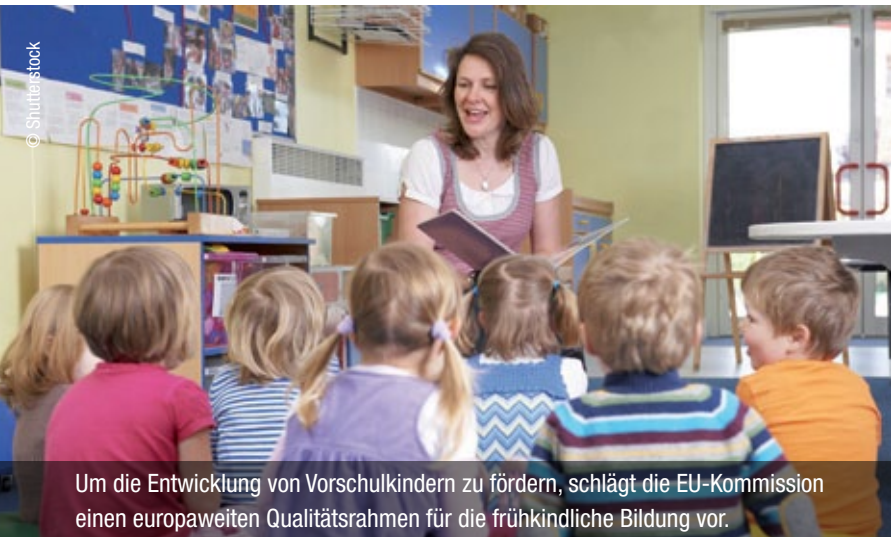
Um die Entwicklung von Vorschulkindern zu fördern, schlägt die EU-Kommission einen europaweiten Qualitätsrahmen für die frühkindliche Bildung vor.

> „Die Bildungs-, Kultur- und Jugendpolitik spielt eine zentrale Rolle für die Resilienz, die Wettbewerbsfähigkeit und den Zusammenhalt des Europa von morgen“, sagte der zuständige EU-Kommissar Tibor Navracsics bei der Vorstellung der Pläne.