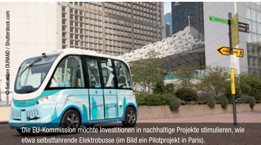
Die EU-Kommission möchte Investitionen in nachhaltige Projekte stimulieren, wie etwa selbstfahrende Elektrobusse (im Bild ein Pilotprojekt in Paris).

Mit dem Ausbau der Kapitalmarktunion will die EU-Kommission Investitionen in umweltfreundliche und sozialverträgliche Projekte fördern. Davon verspricht sie sich nicht nur ein stabileres Finanzsystem, sondern auch eine Kapitalzufuhr für erneuerbare Energien, nachhaltige Landnutzung und Städtebau. So soll der Finanzsektor zu den im UN-Abkommen von Paris vereinbarten Klimaschutzziele beitragen. Mit einem weiteren Vorschlag will die Kommission den Aufbau eines Marktes für Wertpapiere ermöglichen, die durch Staatsanleihen besichert sind. Das soll den EU-Finanzmarkt stabiler machen und Investoren erleichtern, ihre Anlagen in Staatsanleihen breiter zu streuen.