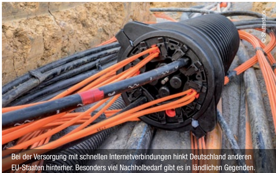
Bei der Versorgung mit schnellen Internetverbindungen hinkt Deutschland anderen EU-Staaten hinterher. Besonders viel Nachholbedarf gibt es in ländlichen Gegenden.

Die europäische Wirtschaft wächst derzeit so schnell wie seit zehn Jahren nicht mehr. Zum ersten Mal seit der Einführung des Euro halten alle Euro-Länder 2018 die Defizitgrenze von 3 Prozent der Wirtschaftsleistung ein. Die derzeit günstigen Bedingungen sollten dafür genutzt werden, die Volkswirtschaften widerstandsfähiger zu machen, rät die EU-Kommission in den länderspezifischen Empfehlungen, die sie den Mitgliedstaaten im Rahmen des Europäischen Semesters zur Koordinierung der Wirtschaftspolitik gibt. Deutschland sollte demnach mehr in Bildung, Forschung, Innovation und Breitbandinfrastruktur investieren, das Steuersystem investitionsfreundlicher machen und mehr Wettbewerb bei Dienstleistungen zulassen.