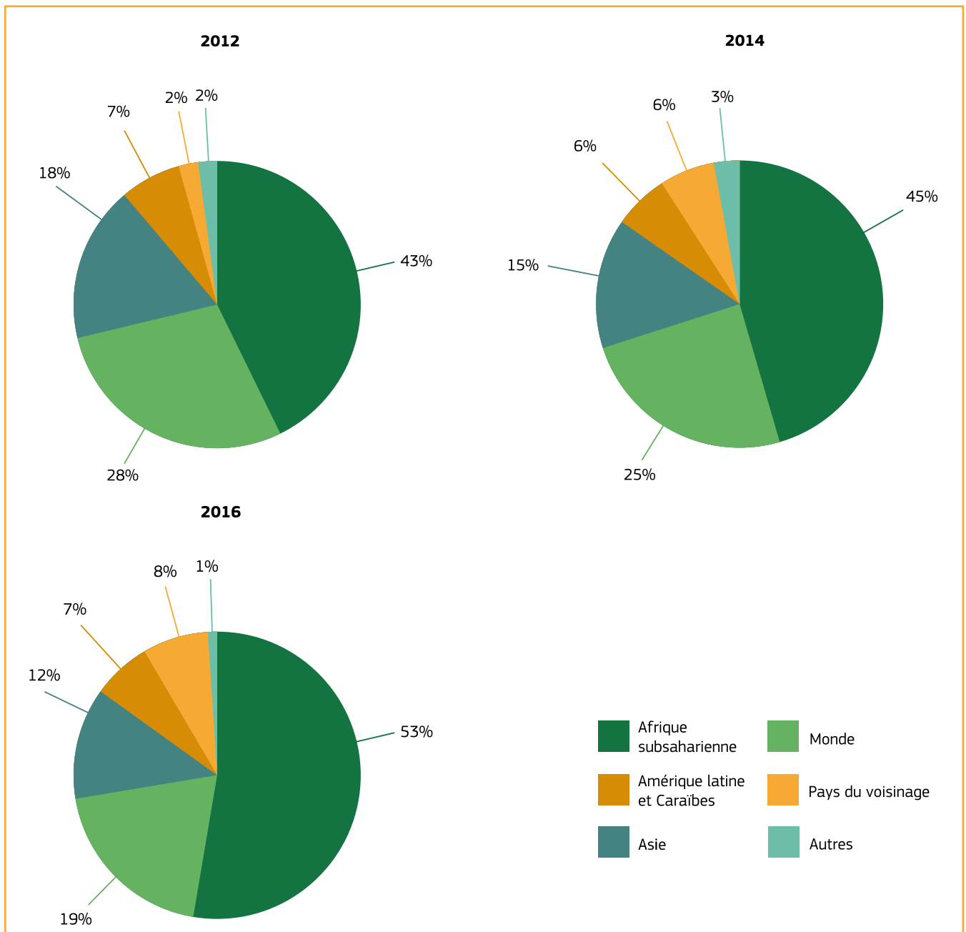
Figure 1: répartition géographique des décaissements d'aide de l'UE et de ses États membres en faveur de la sécurité alimentaire et nutritionnelle en 2012, 2014 et 2016

Tandis que la contribution aux initiatives mondiales et à la fourniture de biens publics mondiaux en soutien à la sécurité alimentaire et nutritionnelle est restée solide (19 % – une baisse par rapport aux 25 % de 2014), l'appui à l'échelon des pays a augmenté en 2016, passant de 66 % à 69 %. Le soutien régional à la sécurité alimentaire et nutritionnelle est passé de 9 % à 12 %.