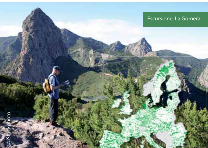
Escursione, La Gomera

Per maggiori informazioni su Natura 2000, consultare: http://ec.europa.eu/environment/nature/index_en.htm