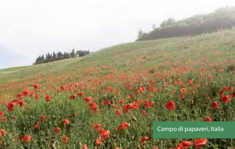
Campo di papaveri, Italia

N.B.: al momento della stampa (giugno 2010) non sono inclusi i dati relativi al Regno Unito e all'Austria. Saranno aggiunte a breve le mappe del Regno Unito. Sono attualmente in corso le trattative con l'Austria.