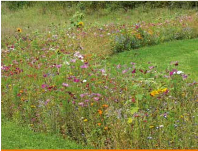
Luonnonvaraisia kukkapenkkejä pölyttäjille