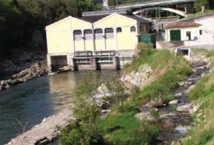
Foto oben: Fischwanderhilfe Foto Mitte: Kiesbank Foto unten: Nebengewässer bei Thalheim