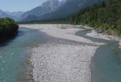
Foto oben: verzweigter Flusslauf des Lech Foto Mitte: kleinräumig sortierte Sedimente Foto unten: mäandrierender Flusslauf der Lafnitz