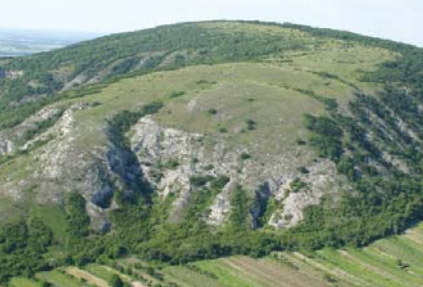
Foto oben: NSG Hundsheimer Berg Foto Mitte: Leinbiene beim Nestbau Foto unten: Zwergiris