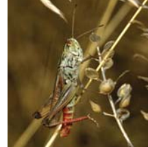
Geschützte Arten nach der VS- bzw. der FFH-Richtlinie (v.l.n.r.): Triel, Bartgeier, Blauracke, Hirschkäfer, Frauenschuh, Eurasischer Grashüpfer

Hirschkäfer, Eschenscheckenalter, Frauenschuh oder Österreichischer Drachenkopf. Aber auch ursprüngliche oder stark bedrohte Landschaften wie Auwälder, Hochmoore oder Trockenrasen finden sich in der Liste der prioritären Lebensräume.