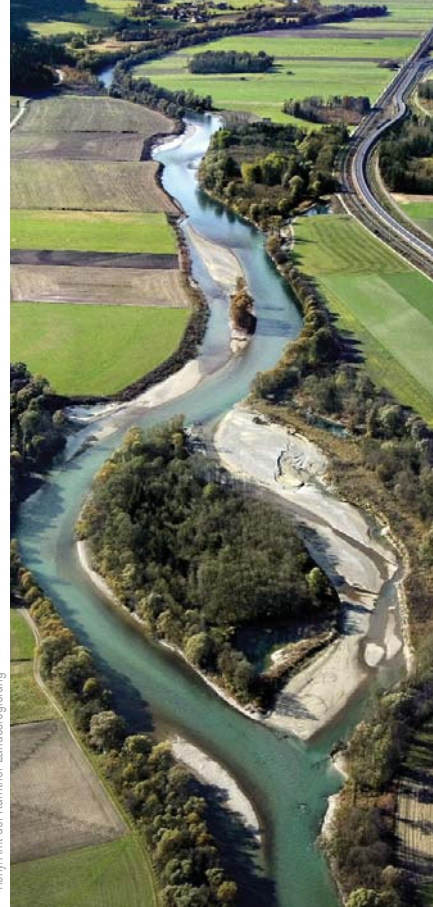
Tichy/Amt der Kärntner Landesregierung

Maßnahmen: Das LIFE-Projekt „Auenverbund Obere Drau“ knüpfte an diese Bemühungen an. Angestrebt wurde die flächenhafte Revitalisierung des Flussbetts und der Auensysteme sowie eine langfristige Sicherung der gewässermorphologischen Verhältnisse. Ein Schwerpunkt lag im Rückbau der Draufer in Verbindung mit großzügigen Flussaufweitungen, durch die auch der Hochwasserschutz verbessert werden konnte. Weiters beinhaltete das Projekt die Schaffung neuer Auwälder und Nebengewässer, die Wiederansiedlung stark gefährdeter bzw. verschollener Tier- und Pflanzenarten sowie andere spezielle Artenschutzmaßnahmen. Umgesetzt wurden auch Maßnahmen zur Stabilisierung der Drausohle.