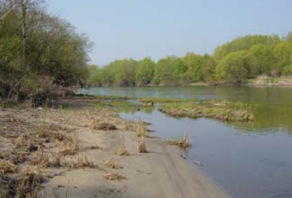
Foto oben: Mündung der Ybbs Foto Mitte: Huchen Foto unten: laichende Barben