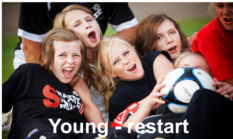
Young - restart