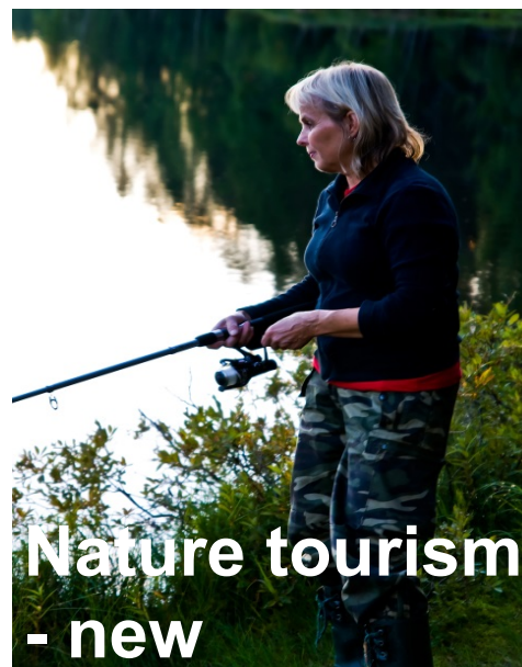
Nature tourism - new