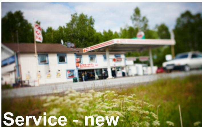
Service - new