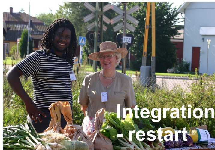
Integration - restart