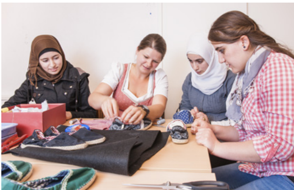
Kółko hafciarskie tworzy produkty takie jak buty, które będą następnie sprzedawane na jarmarku.