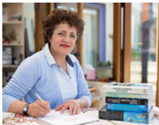
Edie z Albanii skorzystała z wzajemnej pomocy „GrowBiz” w zakresie rozwijania pomysłu na działalność.