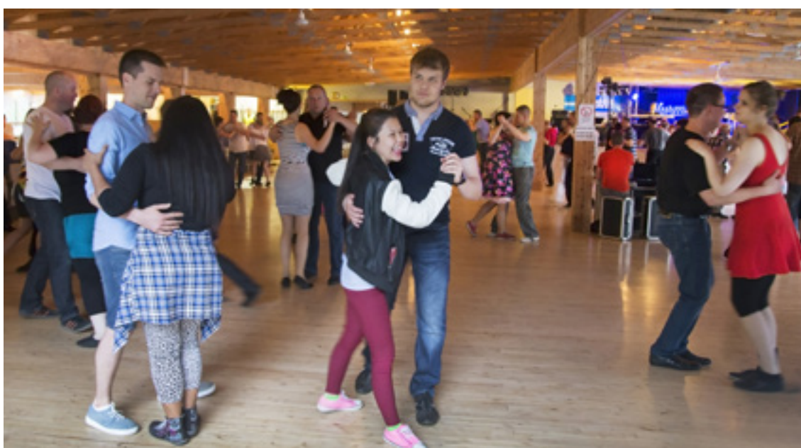
Wydarzenia społeczne organizuje się w celu zintegrowania społeczności i pojedynczych osób.