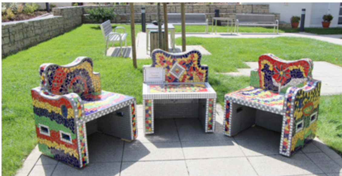
„Ławki integracyjne” stanowią miejsce spotkań międzykulturowych oraz symbol integracji społecznej.

Służby koordynacyjne projektu ściśle współpracowały ze szkołami, ośrodkami dla młodzieży, instytucjami kultury i klubami sportowymi, aby podnieść świadomość w zakresie różnorodności oraz zorganizować działania społeczności.