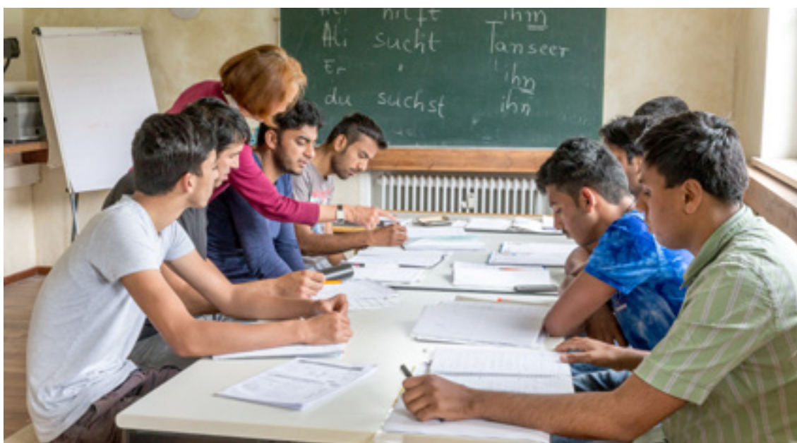
Na danym terytorium organizuje się wiele kursów językowych, aby pomóc imigrantom w nauce języka niemieckiego.

W ramach LGD przedstawiciele gminy, partnerzy biznesowi i społeczni mogą na równi podejmować decyzje, jeżeli chodzi o prowadzone działania. Ważnym aspektem jest udział obywateli zarówno na szczeblu decyzyjnym, jak i wdrożeniowym. Zachęca to ludzi do brania odpowiedzialności za swoją społeczność, a także do większego zaangażowania politycznego i społecznego w projekty takie jak „Meine Gemeinde”.