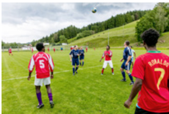
Imigranci i mieszkańcy spotykają się podczas zajęć takich jak piłka nożna.