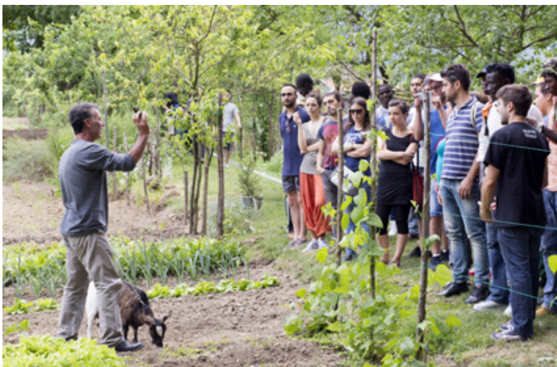
Młodzi Włosi i imigranci przeszli razem szkolenie w zakresie rolnictwa.

Uczestnicy projektu dokonali oceny najlepszych praktyk, aby ułatwić imigrantom angażowanie się w gospodarkę lokalną i kontekst społeczny. Sporządzono również spis wolnych gruntów w pięciu gminach na terytorium LGD, które potencjalnie mogłyby zostać przydzielone do użytku osobom bezrobotnym.