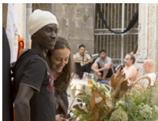
Kilkoro imigrantów działa aktywnie w stowarzyszeniu Rise Hub, które powstało w wyniku projektu.