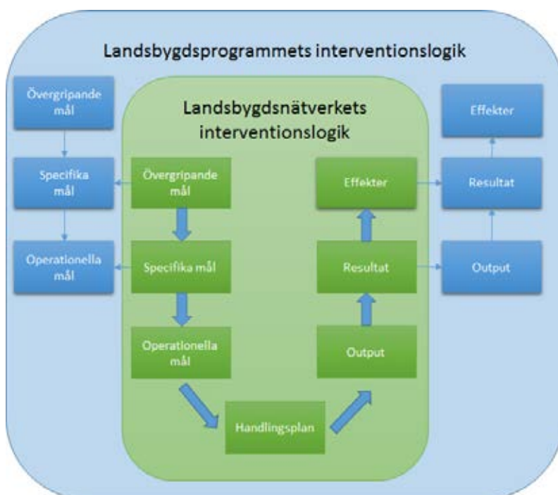
Figur 2. Schematisk bild av interventionslogiken.

I nedanstående avsnitt presenteras Landsbygdsnätverkets interventionslogik inför år 2017–2018.