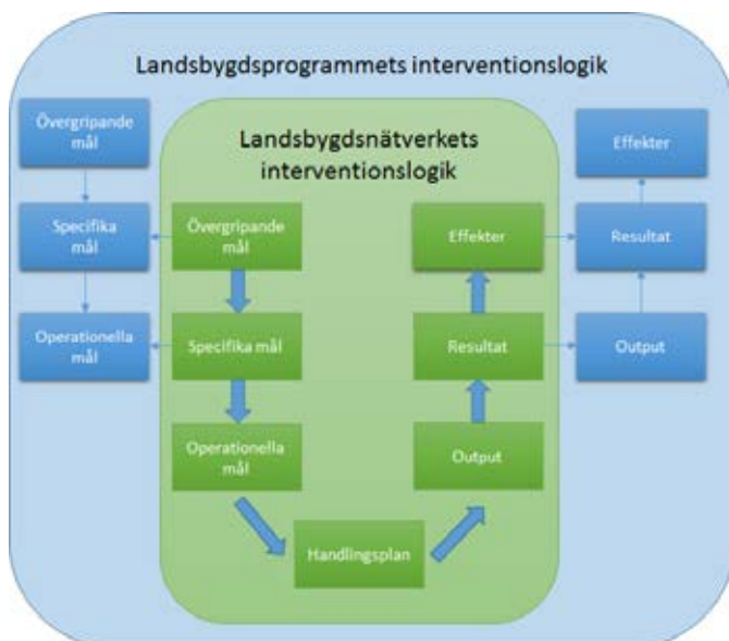
Figur 1. Landsbygdsnätverkets principiella interventionslogik som en del landsbygdsprogrammets interventionslogik.

Interventionslogikens principer illustreras enligt nedan: