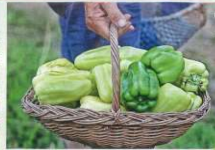
Pravi bolničarji in škodljivcem se borijo predvsem z zdravimi in občutnimi rastlinami, ki jih vzgojijo sami.