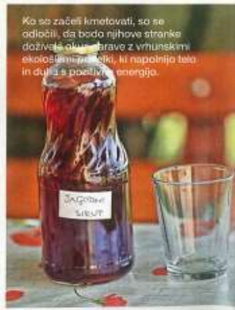
Ko so začeli kmetovati, so se odločili, da bodo njihove stranke doživle okus hrane z vrhunskimi ekološkimi pridelki, ki napolnijo telo in duha s pozitivno energijo.

da preverim, kaj se bo zgodilo, če jih sploh ne potkropim.« In kaj se je zgodilo? »Nič. Nobene razlike nisem opazil. Res je, da je bila zemlja takrat še spočita, jagode smo imeli zavarovane s streho, tudi vreme je bilo tisto leto ugodno. Takrat sem se odločil, da popolnoma preneham s škropljenjem.« Nekaj let je jagode gojil po svoje, začel je gojiti še zelenjavo, leta 2003 pa kmetijo preusmeril v ekološko pridelavo. Devet let kasneje se je preusmeril še v certificirano biodinamično pridelavo Demeter, ki označuje pridelke, pridelane po načelih biodinamike, in pomeni hrano najvišje kakovosti. Odločitev za biodinami-