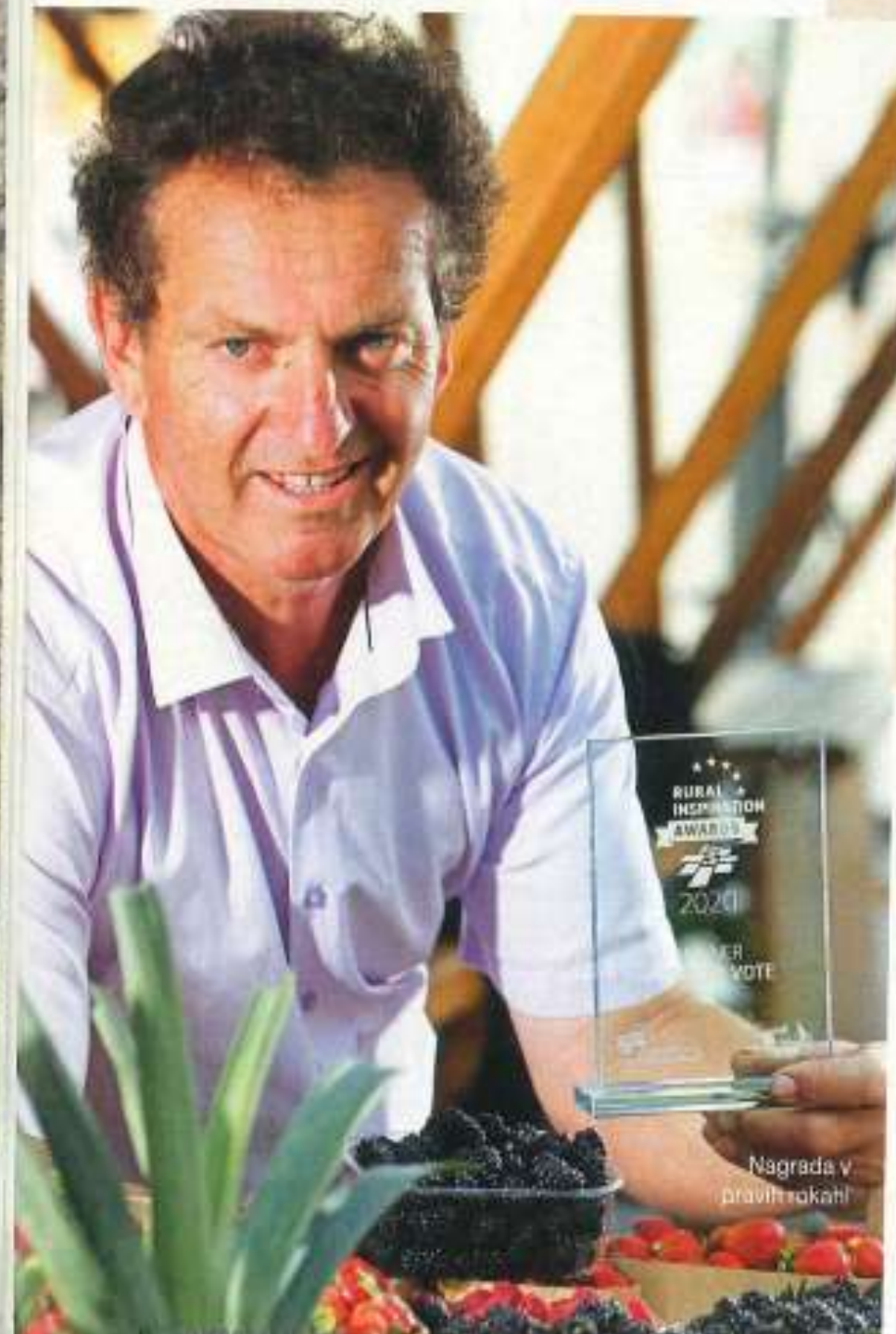
Nagrada v pravih rokah!

dar jim takoj povem, da niso za splošno uporabo. Tam, kjer kmetujejo na konvencionalen način, ne bodo učinkovali, saj ti preparati v kombinaciji s kemijo ne učinkujejo. Pomembno pa je tudi, da v kmetovanje daš svojo energijo in dušo. Menim, da je treba ljudem pustiti, da se odločajo po svoje. Če jim bo dano, bodo že našli smer, ki jih bo pripeljala na našo pot.»