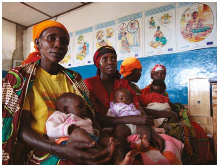
Centre de santé au Burundi.

“ Mesurer l'impact par rapport à la réduction et la prévention de la sous-nutrition et de la mortalité en contexte d'urgence et tirer les leçons pour nourrir les réponses futures. ”