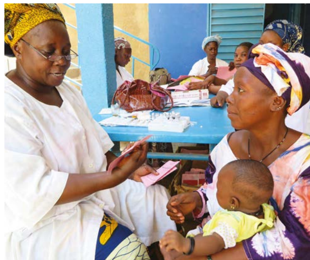
Assistance humanitaire aux communautés déplacées et hôtes à Mopti, Mali central.

La Commission s'assure que, dans la mesure du possible, les besoins nutritionnels à court et plus long terme sont traités d'une manière intégrée et articulée qui évite les lacunes et la duplication dans l'assistance tout en assurant la continuité et en maximisant la durabilité. Pour ce faire, une coordination étroite est promue avec d'autres bailleurs internationaux et acteurs nationaux. Par exemple, le travail qui est actuellement en cours dans les initiatives internationales et régionales comme le SUN (Scale Up Nutrition en anglais) peut présenter d'importantes opportunités pour une planification conjointe plus efficace. Cependant, pour que les interventions soient plus efficaces, chaque situation nationale doit être analysée individuellement