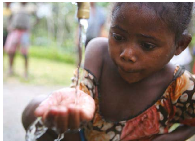
Fananehana : forage de puits utilisant la technique de lançage rapide.