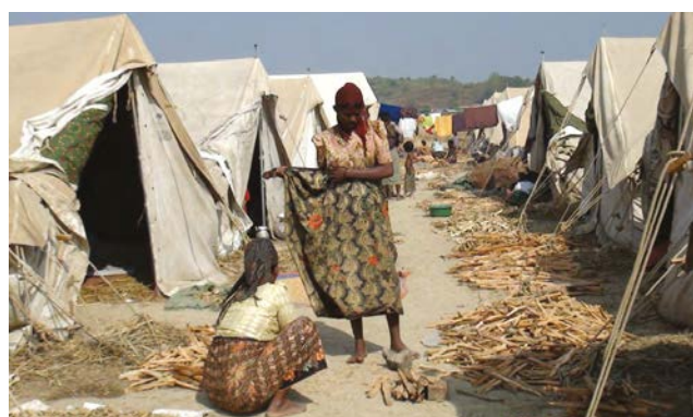
Myanmar : besoins humanitaires urgents dans l'Etat de Rakhine.