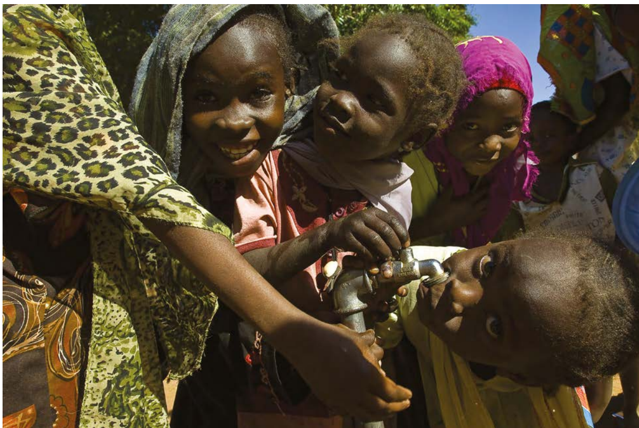
Est du Tchad : journée mondiale de l'enfance.

Si possible, ces actions sont conçues et mises en œuvre en coordination avec tous les acteurs pertinents, y compris les chefs et/ou les représentants communautaires, et en accord avec les autorités locales/nationales.