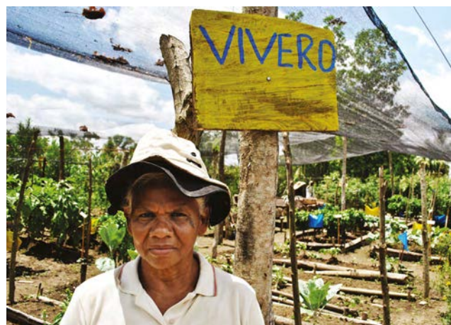
Une femme bénéficiaire d'aides humanitaires en Colombie.

Là où répondre à la sous-nutrition est un objectif important des