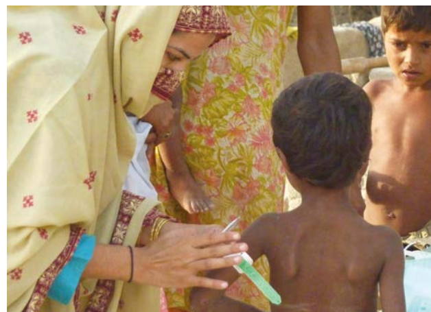
Inondations au Pakistan.