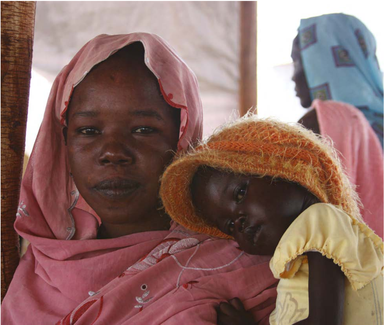
Une mère soudanaise réfugiée attend avec son enfant malade à l'hôpital de campagne de MSF au Sud-Soudan.

peuvent notamment impliquer: la destruction à grande échelle des biens et des infrastructures, l'érosion des moyens d'existence et du pouvoir d'achat, un arrêt et une réduction de l'accès aux services essentiels dont les services de santé, l'approvisionnement en eau et l'assainissement, le déplacement d'un grand nombre de personnes. Les urgences peuvent aussi perturber les systèmes sociaux et la qualité des pratiques de soins/d'alimentation. L'accès des ménages à l'alimentation peut être affecté négativement et les personnes peuvent se retrouver dans des installations surpeuplées où leur famille est divisée. Par conséquent, au niveau individuel, il existe souvent un risque accru de détérioration de la santé et de l'état nutritionnel qui entraîne une hausse de la probabilité de décès (voir Schéma 1 : Le cadre conceptuel).