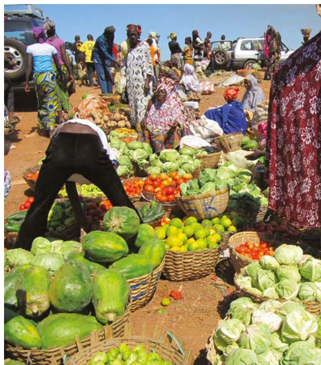
Marché dans le district de Kati (Mali).