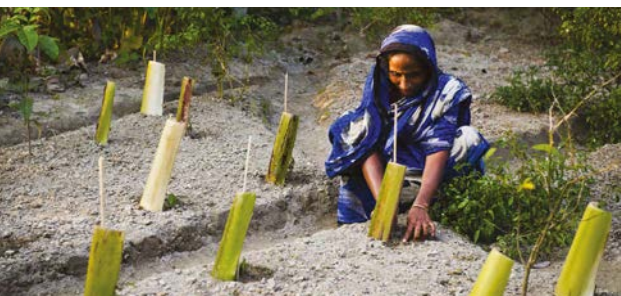
Bangladesh - novembre 2012.

Leçons apprises: Les transferts monétaires ont potentiellement un impact positif sur la stimulation des marchés locaux et la diversité alimentaire. Ils doivent cependant être accompagnés par des interventions spécifiques en nutrition/santé pour traiter la complexité de la sécurité nutritionnelle avec une attention particulière pour les enfants de moins de cinq ans.