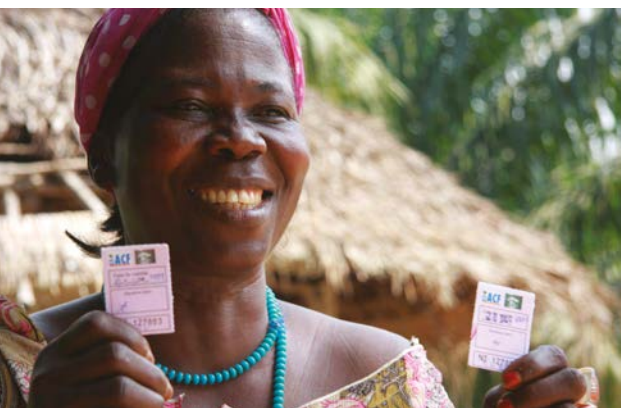
Vendeuse de poissons montrant des coupons d'achat

blée en échange du temps ou du travail d'un bénéficiaire (par exemple, argent contre travail, vivres contre travail, vivres contre formation, vivres contre actifs);