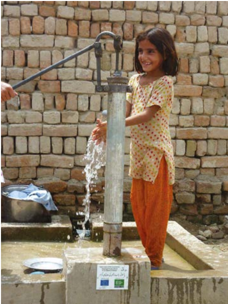
Inondations au Pakistan.