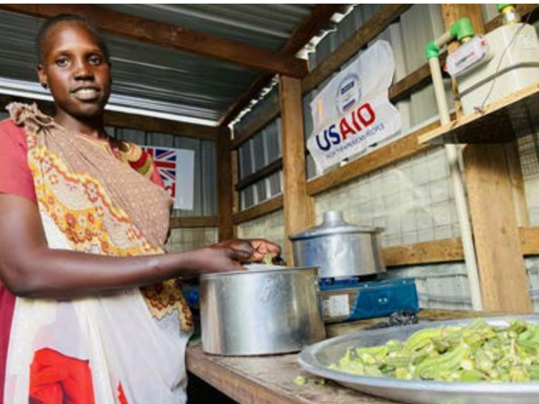
Femme déplacée cuisinant avec du biogaz produit à partir de boues fécales traitées dans le PoC de Malakal.

et des réticences. Il est donc essentiel de sensibiliser les utilisateurs et les principales parties prenantes de la communauté tout au long du projet.