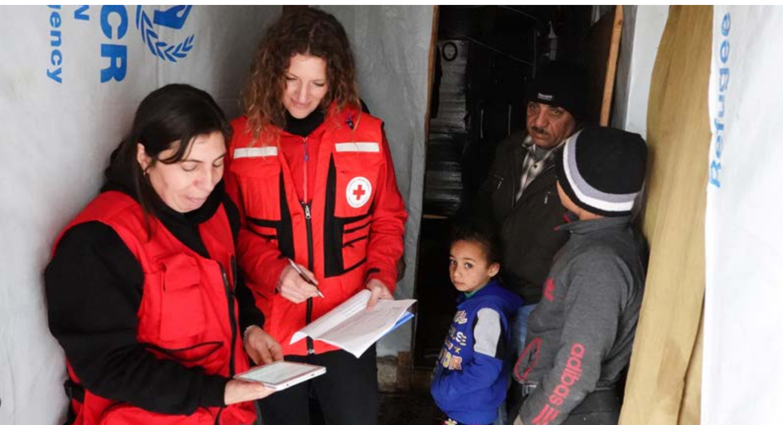
Évaluation environnementale au Liban