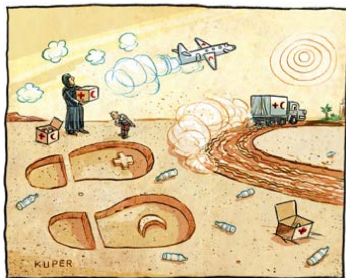
© Peter Kuper / Cartoon Collections

Un aspect important de la « Green Response » est la reconnaissance du fait que l'écologisation de la réponse humanitaire doit renforcer, et non pas saper, les engagements qui visent à augmenter les investissements dans le leadership, la prestation et la capacité des acteurs locaux. Des exigences et des normes de conformité plus strictes doivent s'accompagner d'un soutien à long terme et d'un financement prévisible pour renforcer les politiques et les procédures en faveur de la durabilité climatique et environnementale, mais aussi pour développer et conserver les capacités locales. À ce titre, l'un des objectifs clés de la « Green Response » est d'aider les Sociétés nationales de petite taille à renforcer leur durabilité environnementale et à rendre leurs activités plus écologiques, en établissant des partenariats pertinents avec des acteurs environnementaux et d'autres partenaires dans le pays, ainsi qu'au niveau international.