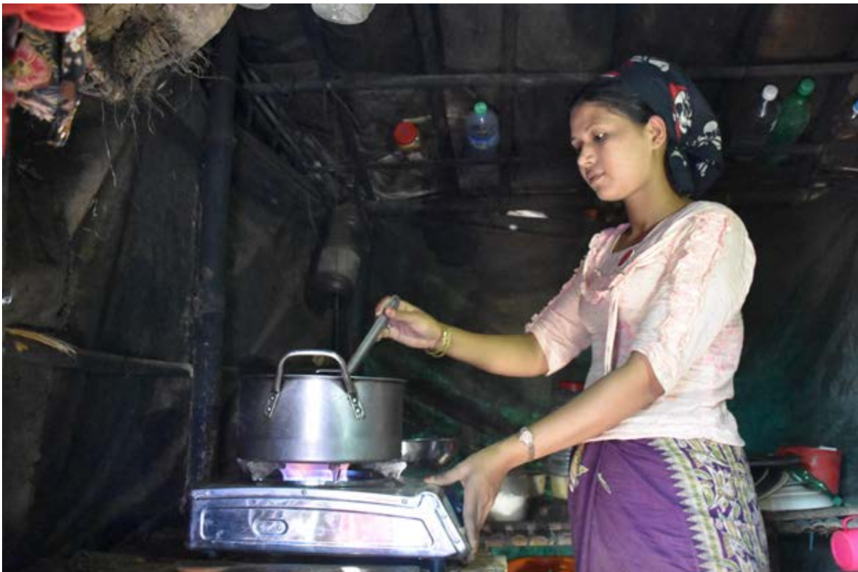
Bangladesh. L'UNHCR distribue des cuiseurs et des bouteilles de gaz de pétrole liquéfié (GPL) à des réfugiés au Bangladesh.

articles non alimentaires. Et ce d'autant plus que le bois est utilisé pour la cuisson des aliments distribués, la conservation des aliments et la purification de l'eau par ébullition, mais aussi vendu au titre d'activité génératrice de revenus (Groupe URD, 2017).