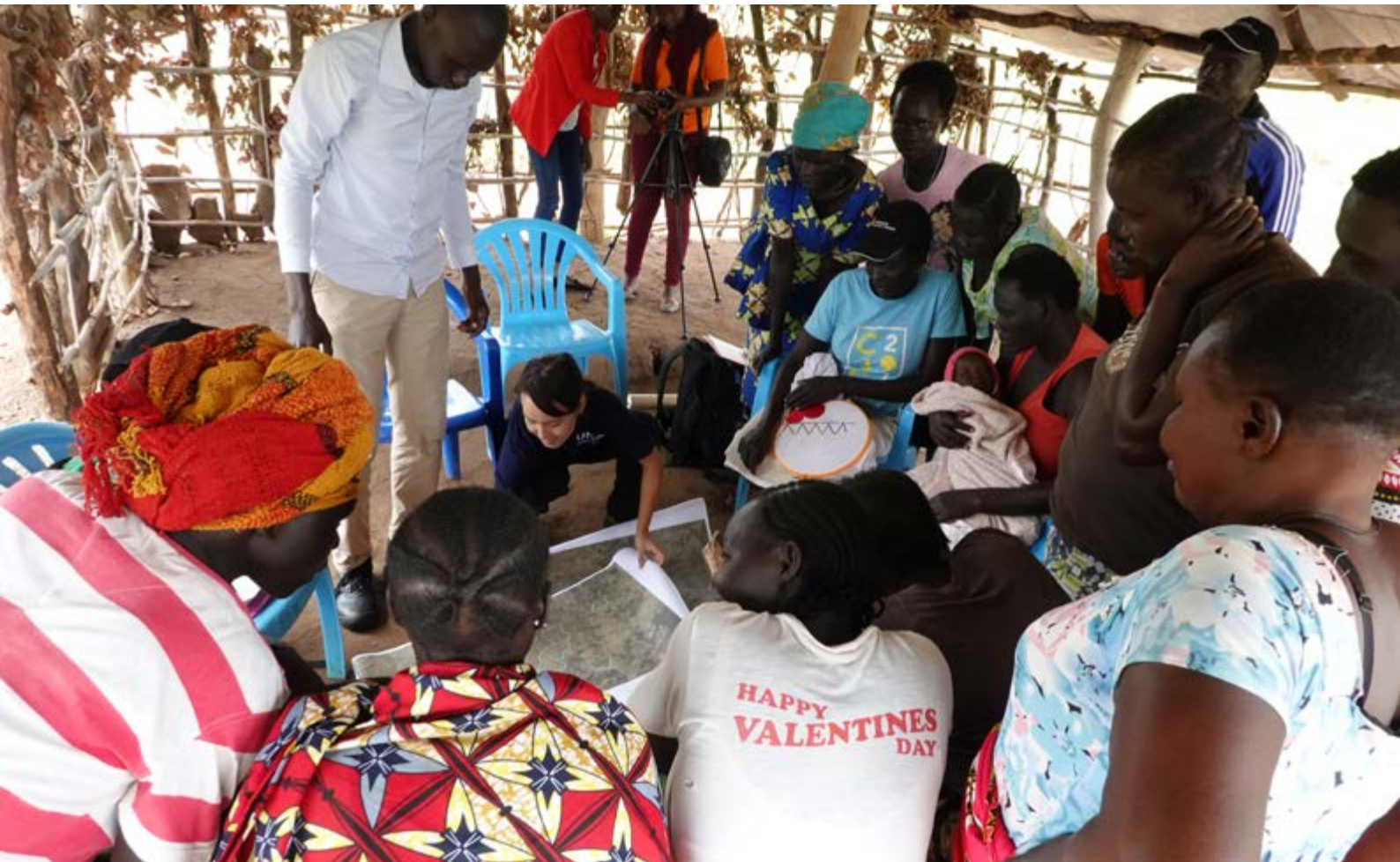
Camp de réfugiés en Ouganda 2019