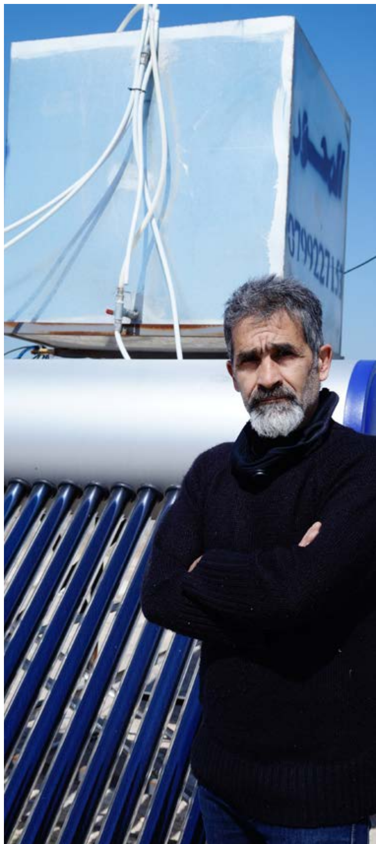
Projet de réduction de la pauvreté grâce aux énergies renouvelables pour les réfugiés (RE4R), installation de chauffe-eau solaires.

L'accès à l'énergie pour cuisiner, se chauffer et s'éclairer est un élément du droit à un logement décent 13 que les personnes déplacées ont beaucoup de mal à obtenir. À cet égard, NRC a réussi à répondre à ces deux besoins : l'accès aux abris et la réduction de l'empreinte carbone au fur et à mesure de l'amélioration des abris. Alors que les problématiques environnementales gagnent du terrain, NRC continue de se demander comment contribuer au mieux à ce que les personnes puissent vivre décemment durant les différentes étapes de leur déplacement en intégrant des critères de consommation d'énergie durable.