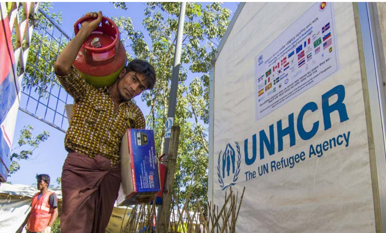
Bangladesh. Un approvisionnement en carburant plus sûr et plus durable pour les réfugiés rohingyas.