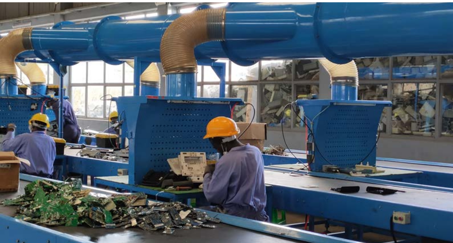
Gestion des déchets électroniques.