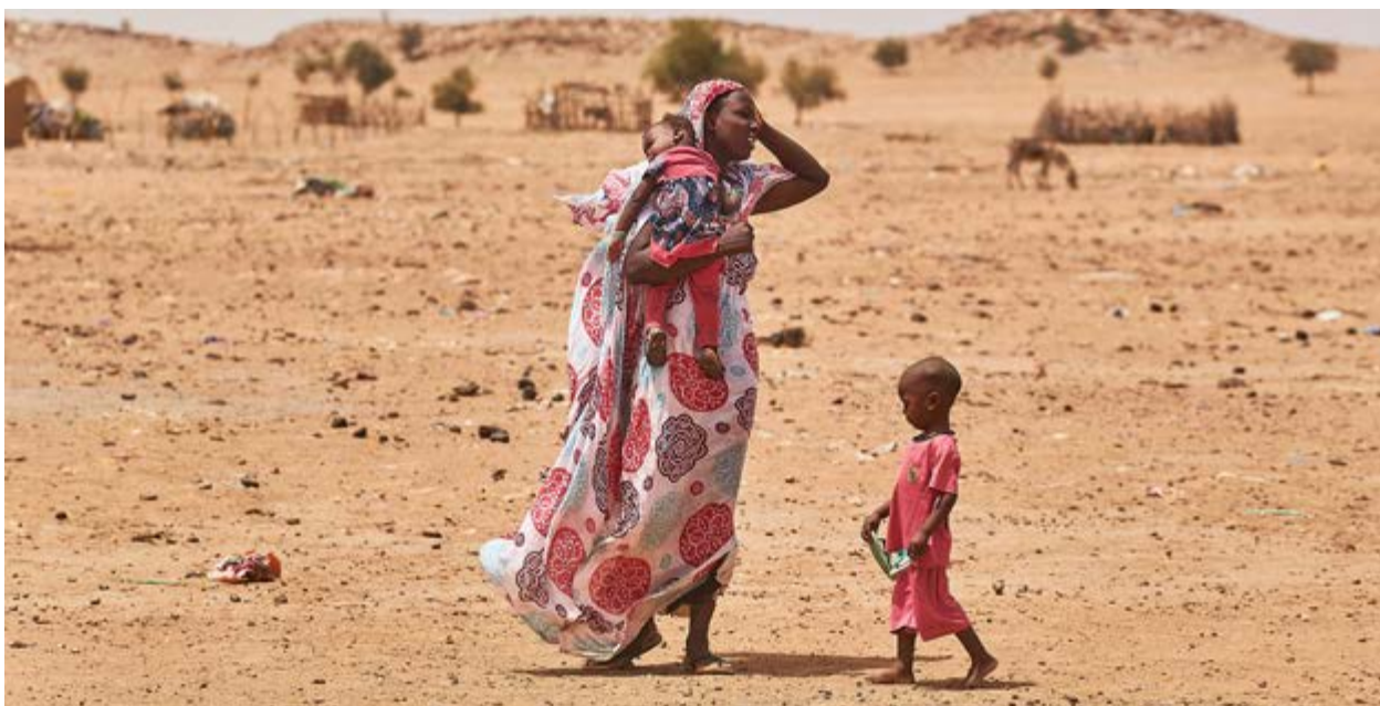
Est du Tchad

plus en plus loin des camps, parcourant jusqu'à 20 km pour s'approvisionner en bois. La surexploitation des ressources naturelles a par ailleurs généré des tensions et conflits entre communautés hôtes et réfugiées.