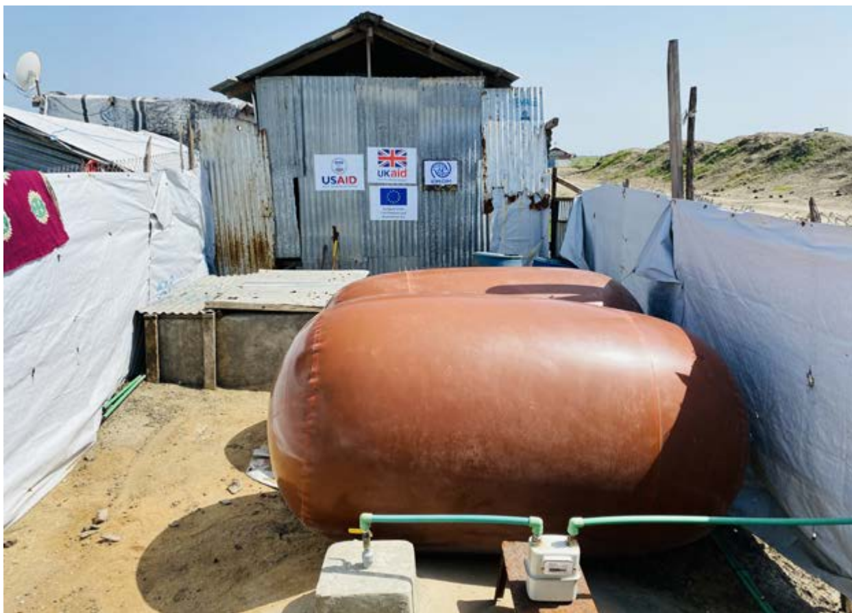
Ballons de stockage de gaz remplis de biogaz produit à partir de boues fécales traitées sur le site de biogaz.

production de gaz optimale. Cette expertise est rare dans le secteur humanitaire et doit être développée au sein des équipes WASH. De plus, les capacités locales de conception et de maintenance de ces systèmes doivent être renforcées pour assurer leur durabilité à long terme.