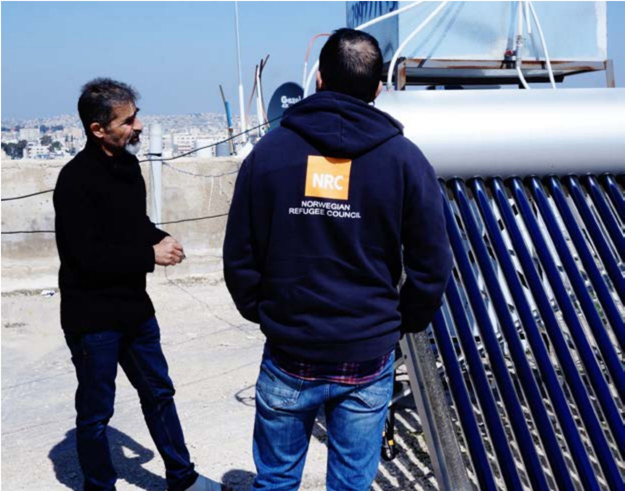
Projet de réduction de la pauvreté grâce aux énergies renouvelables pour les réfugiés (RE4R), installation de chauffe-eau solaires.

en plastique, le bois de chauffage utilisé pour la construction de briques réfractaires ou d'abris, etc.) Pour les mêmes raisons, les projets d'abris présentent un certain nombre d'opportunités pour intégrer les enjeux environnementaux et climatiques.