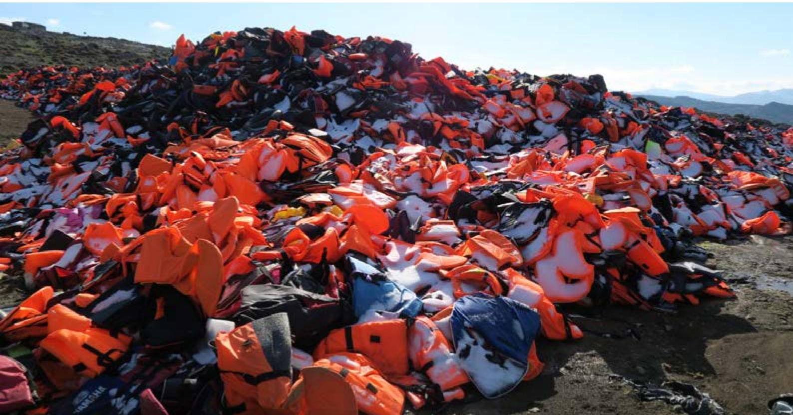
Gilets de sauvetage à Lesbos, Grèce