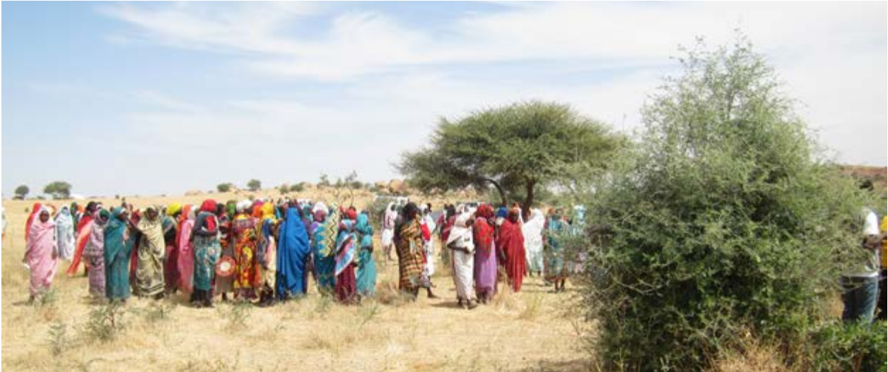
Est du Tchad

Les leçons apprises de l'expérience de la SDC au Tchad concernent premièrement le rôle des bailleurs de fonds dans la réduction de l'empreinte environnementale de l'aide. Convaincu par les bienfaits de cette approche, la Coopération Suisse a pu encourager, orienter et financer la mise en place d'un programme d'aide aux réfugiés par ses partenaires, avec un impact positif sur l'environnement. Ce projet montre par ailleurs de quelle manière le concept du Nexus (humanitaire-développement-paix) peut être opérationnalisé. Pour cela, des synergies entre bailleurs de fonds (et acteurs) humanitaires et de développement poursuivant une approche à long terme est primordiale.