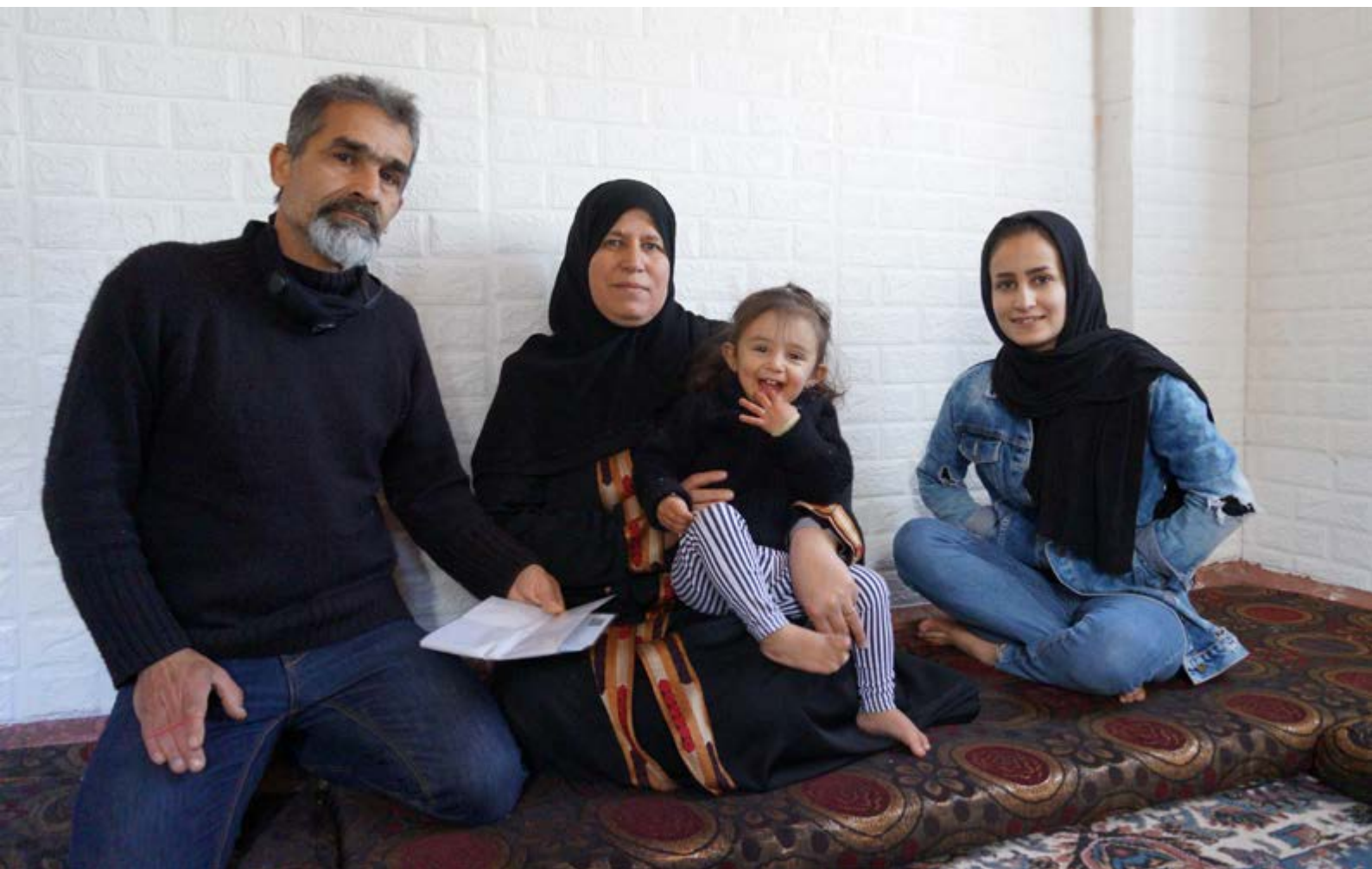
Projet de réduction de la pauvreté grâce aux énergies renouvelables pour les réfugiés (RE4R), installation de chauffe-eau solaires.