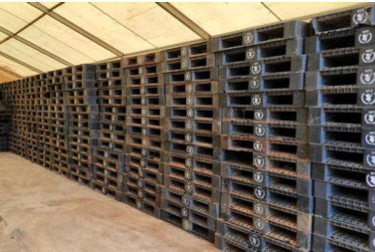
Palettes en polyéthylène haute densité (PEHD)

spécifiques au contexte et diffèrent grandement selon le type de déchet (par exemple, plastique, carton, métal ou déchets électroniques). Cependant, il existe des opportunités de recyclage des déchets produits par les acteurs humanitaires via des réseaux formels et informels de collecte de déchets qui fournissent une source de revenus à un grand nombre de personnes dans les pays en développement.