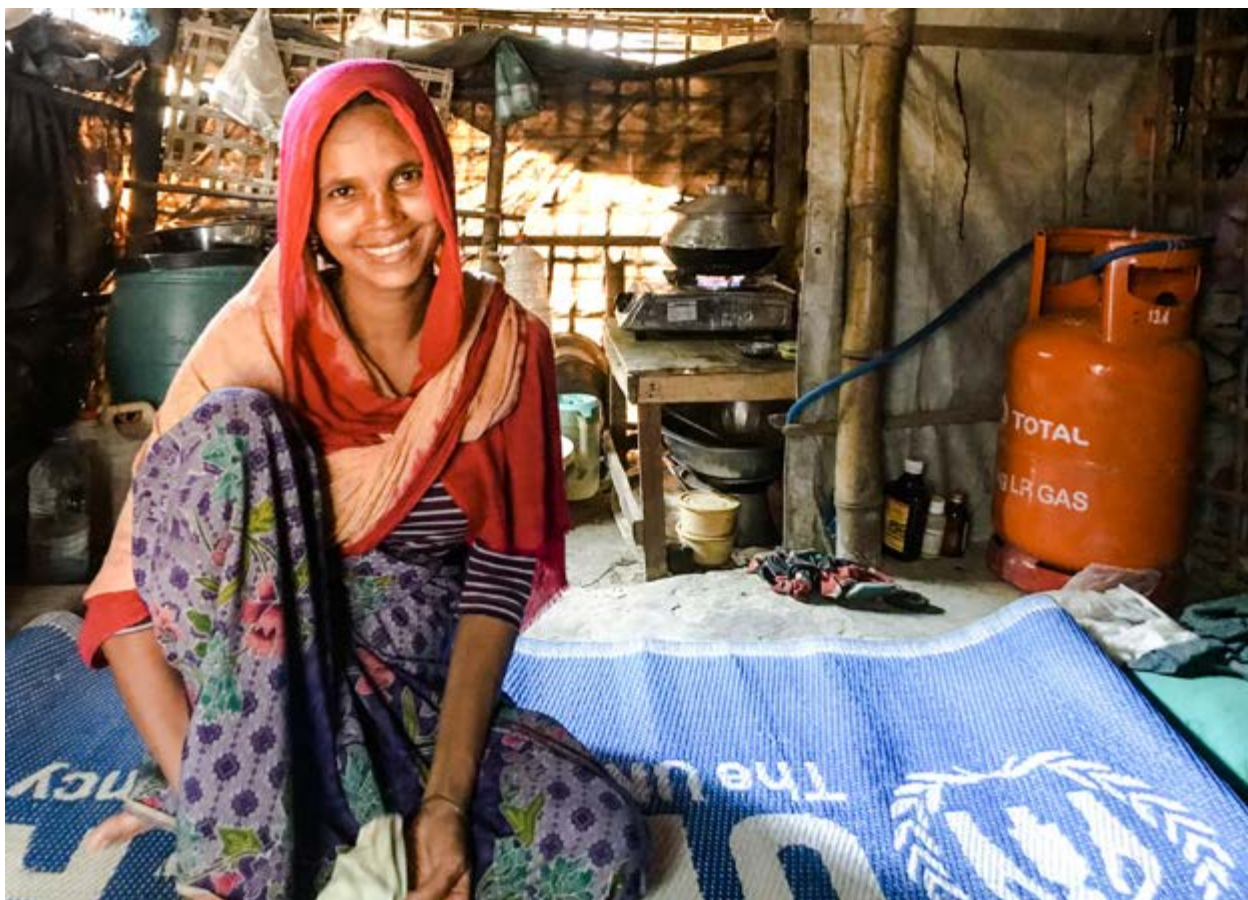
Bangladesh. Le programme de gaz en bouteille atténue la crise du carburant pour les réfugiés rohingyas.

de combiner le projet avec des activités de subsistance afin qu'ils puissent acheter des recharges (en particulier pour la communauté hôte). Dans le cas contraire, la solution risque de ne pas être viable à long terme. Par ailleurs, une idée à explorer pour améliorer l'efficacité du programme pourrait être d'ajuster le volume des bouteilles en fonction de la composition des ménages et de leur consommation, en sachant que cela peut avoir des impacts logistiques considérables et créer parmi les utilisateurs une perception erronée qu'il faudra corriger.