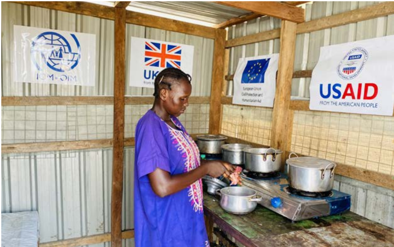
Femme déplacée cuisinant avec du biogaz produit à partir de boues fécales traitées dans le PoC de Malakal.

Le projet de biodigester anaérobie mis en œuvre par l'OIM 2 dans le deuxième plus grand camp de déplacés du Soudan du Sud 3 offre des opportunités intéressantes pour aborder à la fois les questions d'eau-assainissement-hygiène (WASH) et d'énergie dans un contexte opérationnel difficile. Il s'agit d'une chambre étanche à l'air dans laquelle les excréments sont stockés et traités. Le biodigester produit de plus du biogaz qui peut être brûlé pour fournir de l'énergie destinée à la cuisine, l'éclairage ou la production d'électricité 4 .