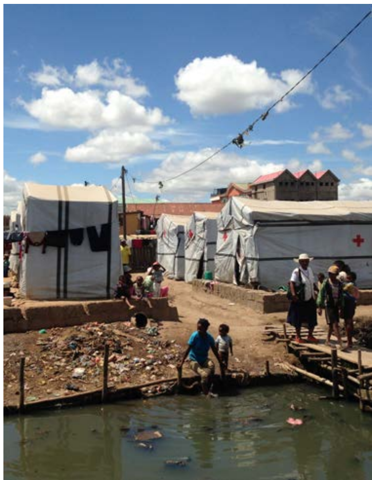
Flooding in Madagascar.

L'expérience du CICR permet de comprendre que la réalisation d'un bilan carbone est un processus continu au cœur duquel se trouve l'élaboration d'une feuille de route visant à réduire et suivre les émissions et non le calcul initial en soi. La fréquence de la mise à jour dépend des ressources disponibles au sein de l'organisation, de la facilité à mobiliser les données 13 et de l'évolution du volume des activités. Dans ce cadre, la réduction nette des émissions d'une année à l'autre est complexe au vu de la croissance des besoins humanitaires et, par conséquent, du volume des activités des organisations.