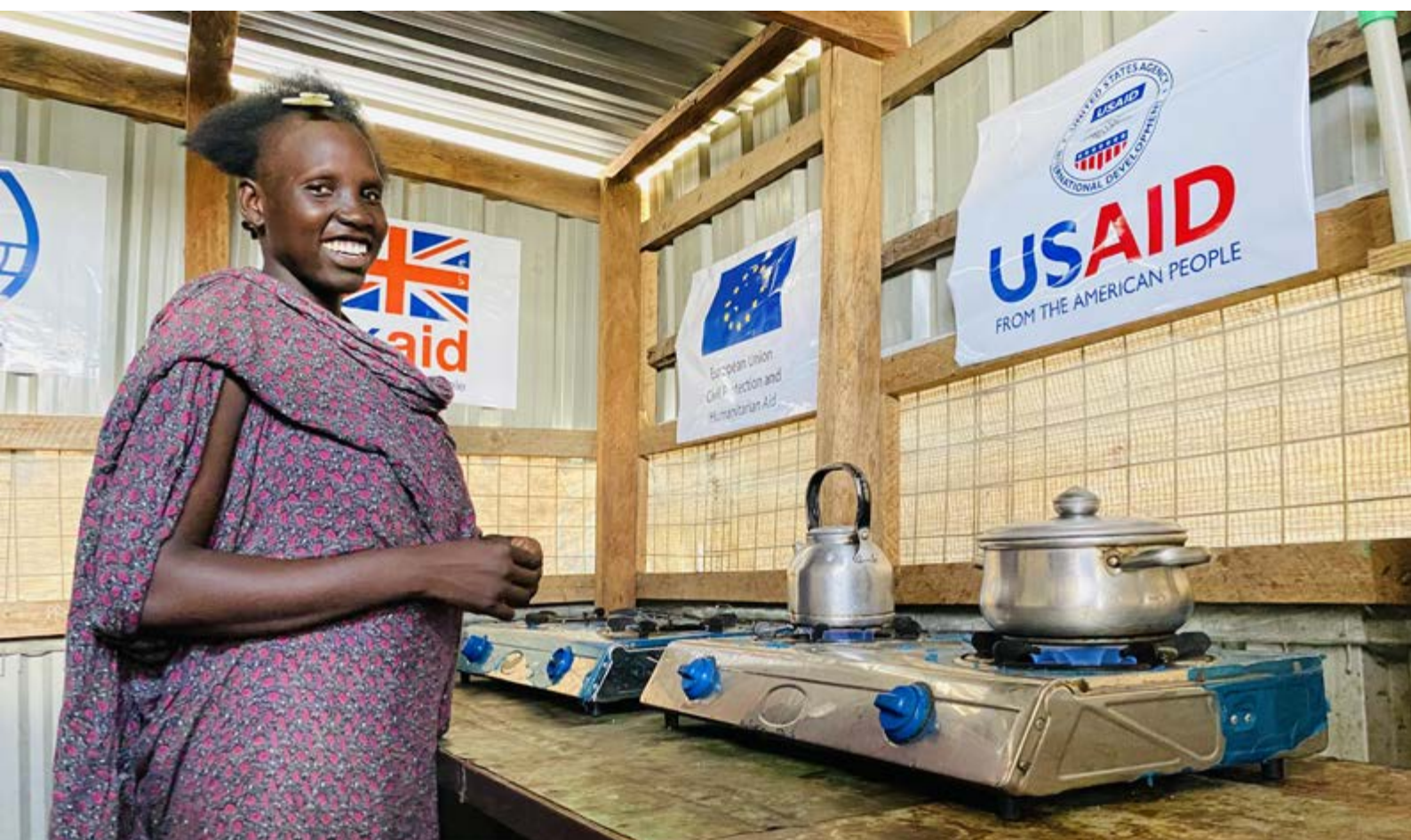
Femme déplacée cuisinant avec du biogaz produit à partir de boues fécales traitées dans le PoC de Malakal.