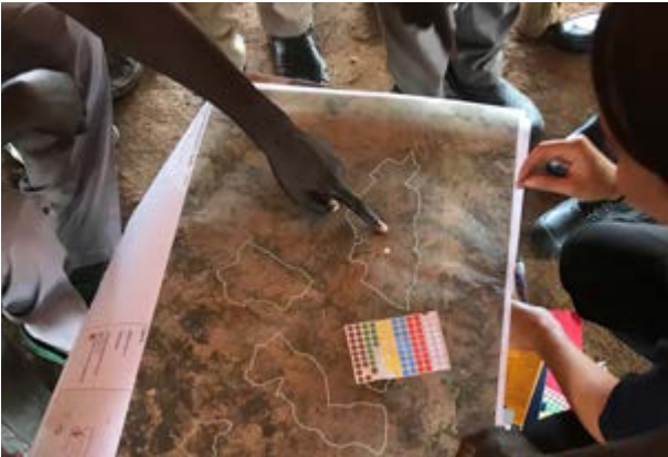
Camp de réfugiés en Ouganda 2019

de plus d'indications sur ce qu'il faut faire en priorité et l'élément par lequel commencer.