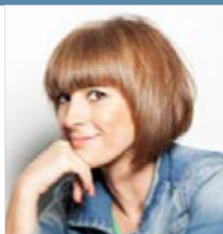
Marta Martí Carrera

Giuseppe byl jmenován vedoucím oddělení pro podniky a internacionalizaci na ministerstvu pro ekonomický rozvoj v roce 2009. Předtím byl v letech 2001 až 2009 generálním sekretářem živnostenské komory. Vyslancem MSP za Itálii je od roku 2011. V roce 2012 byl nominován jako italský ručitel pro mikro, malé a střední podniky.