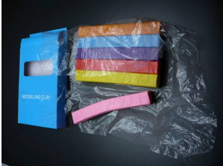
Illustration d'une feuille de plastique faisant partie de l'emballage:

La feuille de plastique sert d'emballage à la pâte à modeler; elle a pour fonction de la protéger contre les souillures et de l'empêcher de sécher durant son transport et son entreposage, mais elle n'est pas destinée au jeu.