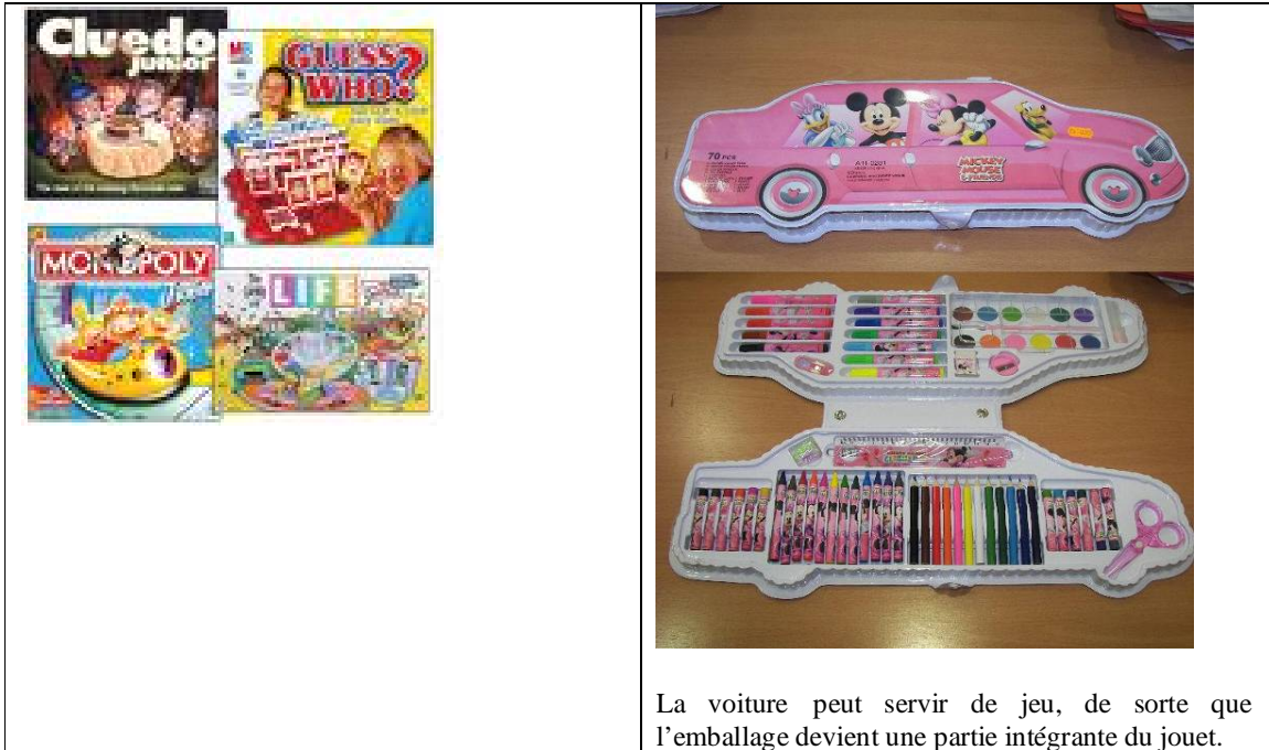
La voiture peut servir de jeu, de sorte que l'emballage devient une partie intégrante du jouet.