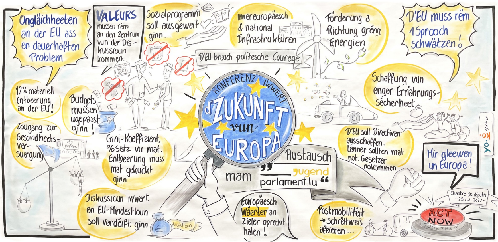
Graphic recording de l'échange avec la Commission spéciale sur l'avenir de l'Europe du Parlement des jeunes

(Chambre des Députés, 29 janvier 2022) - © yo.ko.graphics)