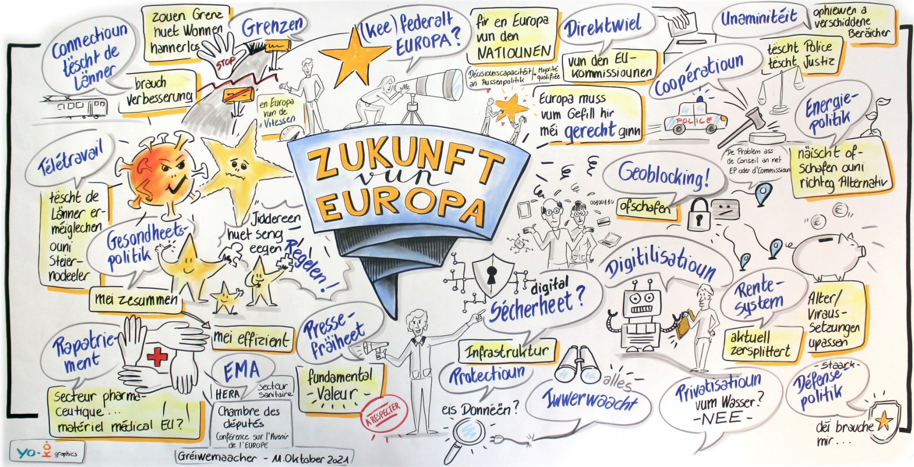
Graphic recording de la rencontre des citoyens dans le Café Kulturhuerf (Grevemacher, 11 octobre 2021) - © yo.ko.graphics)