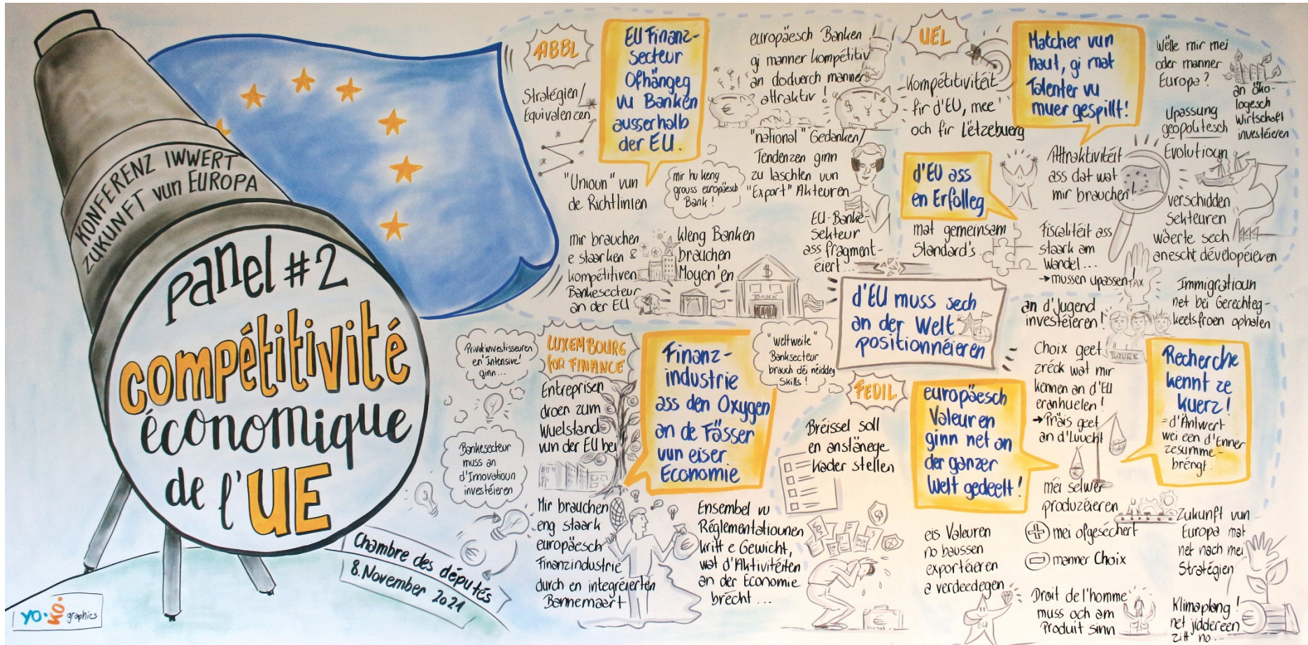
Graphic recording du Panel 2 sur la compétitivité économique de l'UE (Chambre des Députés, 8 novembre 2021) - © yo.ko.graphics)