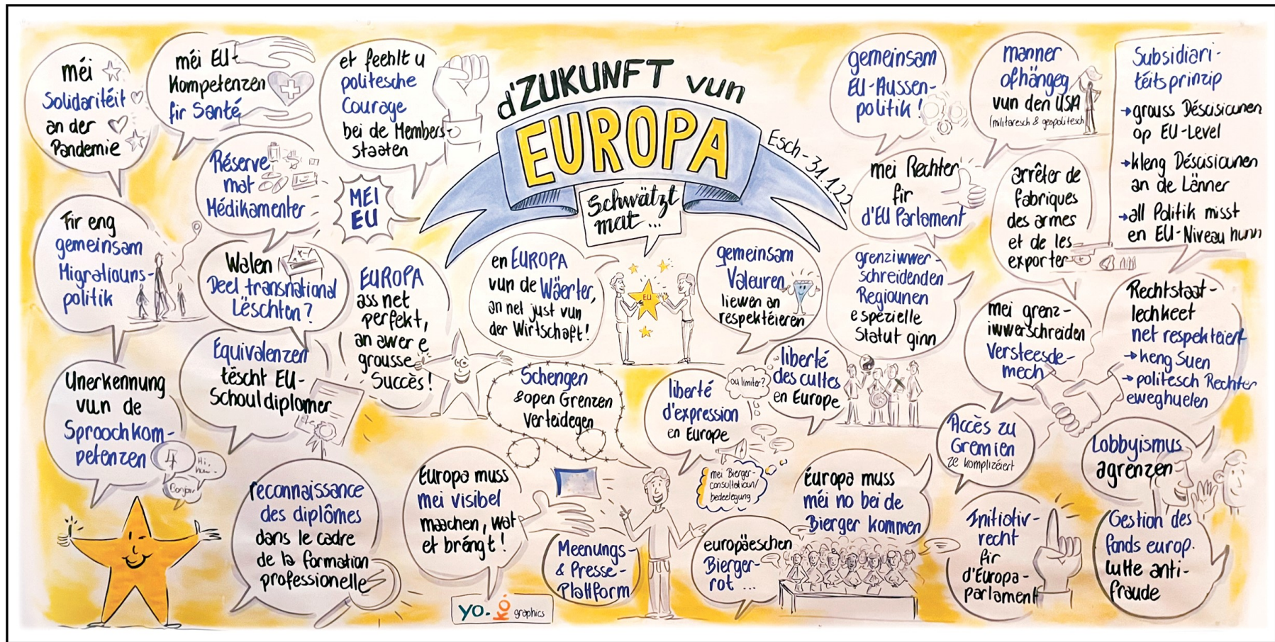
Graphic recording de la rencontre des citoyens dans la Brasserie K116 (Esch/ Alzette, 31 janvier 2022) - © yo.ko.graphics