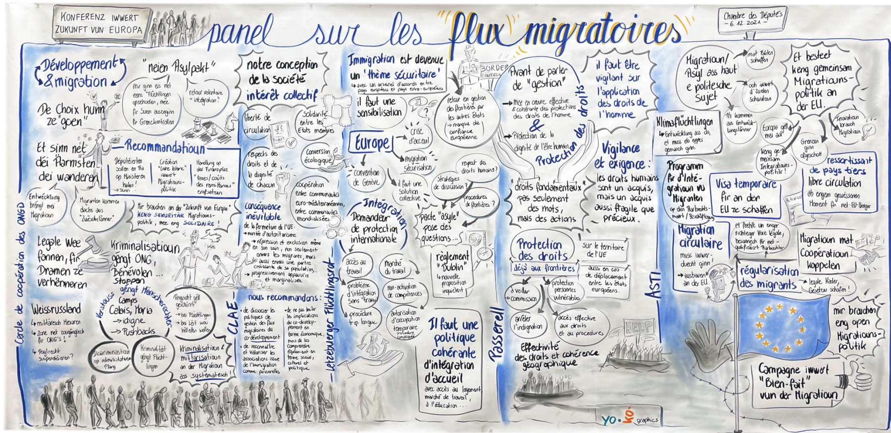
Graphic recording du Panel 3 les flux migratoires (Chambre des Députés, 6 décembre 2021) - © yo.ko.graphics)