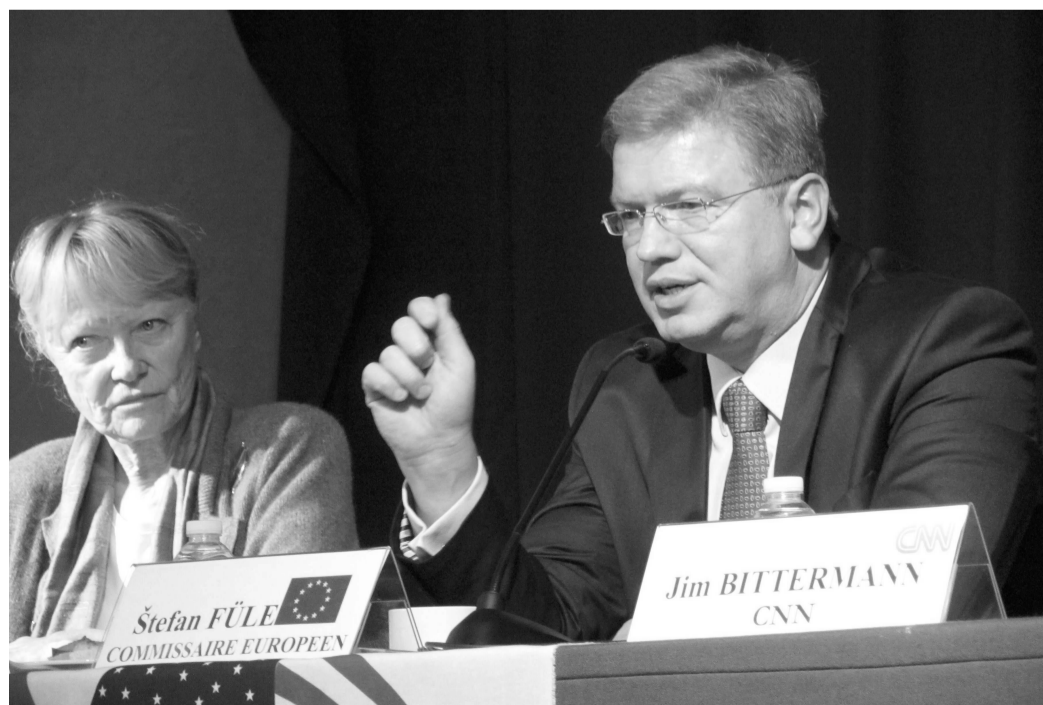
KOMISAŘ v European American Press clubu v Paříži. Zde odpovídal na otázky novinářů.