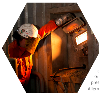
La centrale de houille de Staudinger, employé, Grosskrotzenburg, près de Francfort, Allemagne