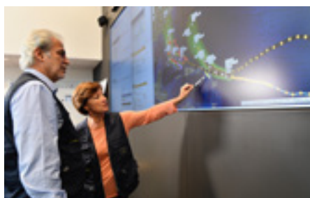
Christos Stylianides sa Lárionad Comhordúcháin Práinnfhreagartha