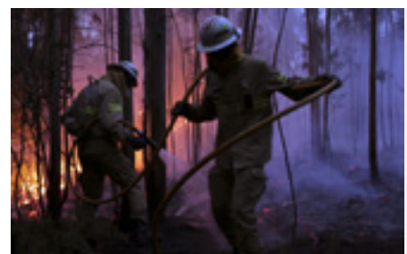
Comhraiceoirí dóiteáin de Gharda Náisiúnta Poblachtach na Portaingéile, Avelar