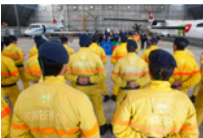
An Coimisinéir Stylianides ag tabhairt cuairte ar an bPortaingéil, 13 Feabhra 2017

Leis an gcóras nua rescEU a bhunú agus freagairt an Aontais, i dtéarmaí na cosanta sibhialta, a neartú chun saoránaigh a chosaint, tá sé beartaithe ag an gCoimisiún méadú nach beag a dhéanamh ar bhuiséad an tSásra Aontais um Chosaint Sibhialta ag an gCoimisiún, ó €577 milliún in 2014-2020 go €1.4 billiún in 2021-2027 .