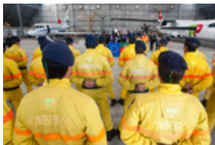
Visite du commissaire Stylianides au Portugal, le 13 février 2017

En vue de mettre en place le nouveau système rescue et de renforcer la réaction de l'UE en matière de protection civile au bénéfice des citoyens, la Commission propose une augmentation significative du budget du mécanisme de protection civile de l'UE, qui passerait de 577 millions d'euros pour la période 2014-2020 à 1,4 milliard d'euros pour la période 2021-2027 .