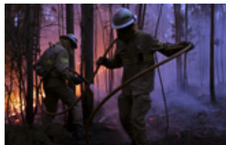
Les pompiers de la garde républicaine nationale du Portugal, Avelar