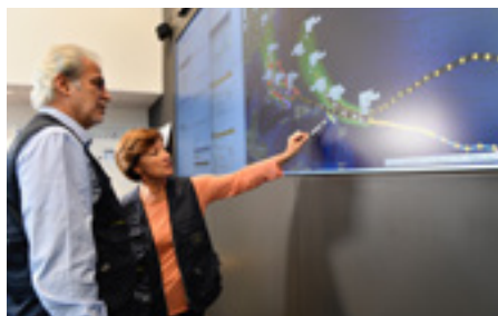
Christos Stylianides au Centre de coordination de la réaction d'urgence