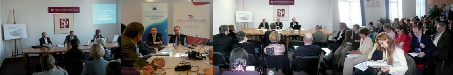
Fundacja Instytut Spraw Publicznych

Fundacja od 14 lat analizuje ważne problemy społeczne i polityczne, inicjuje debaty publiczne oraz przedstawia rekomendacje służące poprawie rozwiązań prawnych i instytucjonalnych. Innymi celami jej działalności są: sygnalizowanie zagrożeń dla życia publicznego i budowanie współpracy pomiędzy środowiskami polityków, naukowców, dziennikarzy i działaczy organizacji pozarządowych.