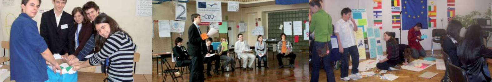
„European Parliament for Youth”, Centrum Edukacji Obywatelskiej