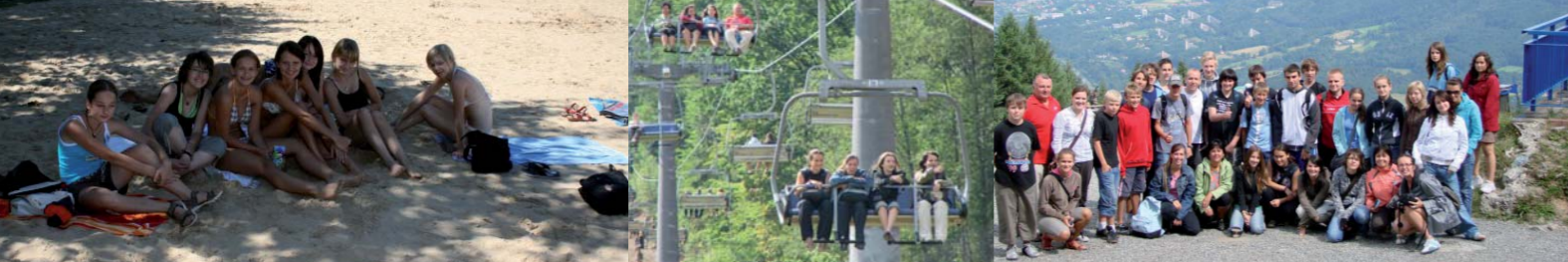
„International Youth Camp Pszczyna 2008”