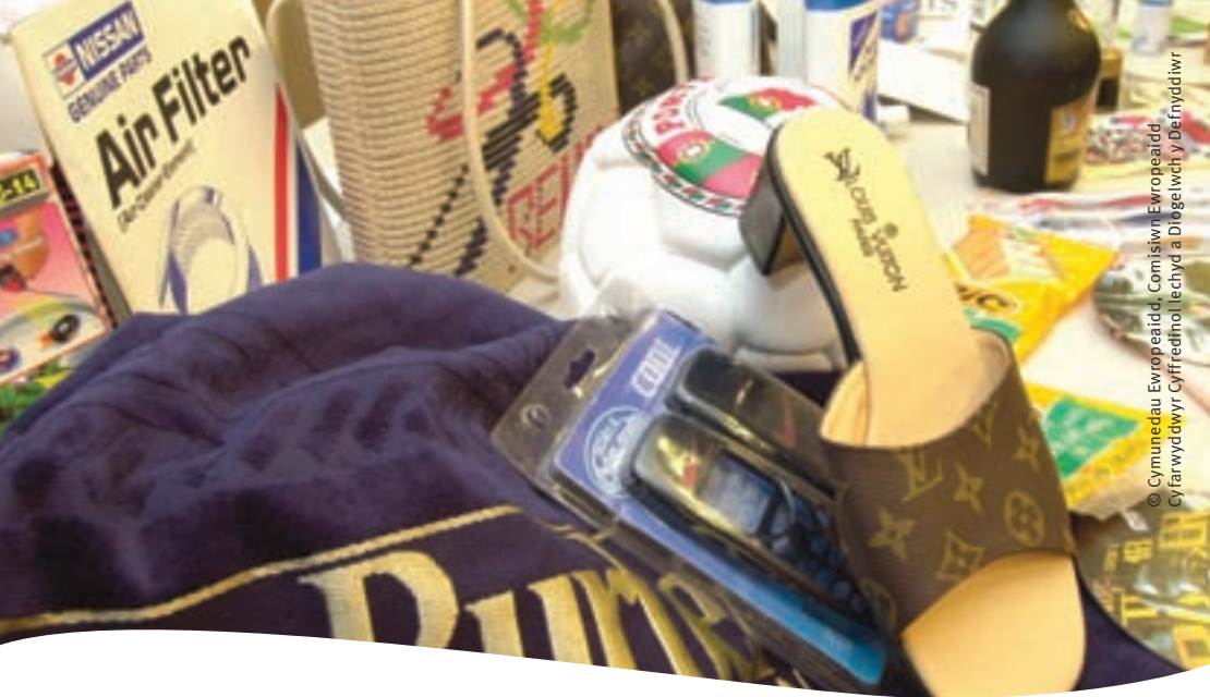
© Cymunedau Ewropeaidd, Comisiwn Ewropeaidd, Cyfarwyddwyr Cyffwrdd Ffug a Dynwaredol y Ddiwydiol

Bellach nid nwyddau moeth yn unig sy'n cael eu ffugio a'u dynwared. Fwyfwy mae hyn yn effeithio ar nwyddau masgynnyrch fel bwyd, cosmetigau, teganau, meddyginiaethau a chydrrannau ceir.