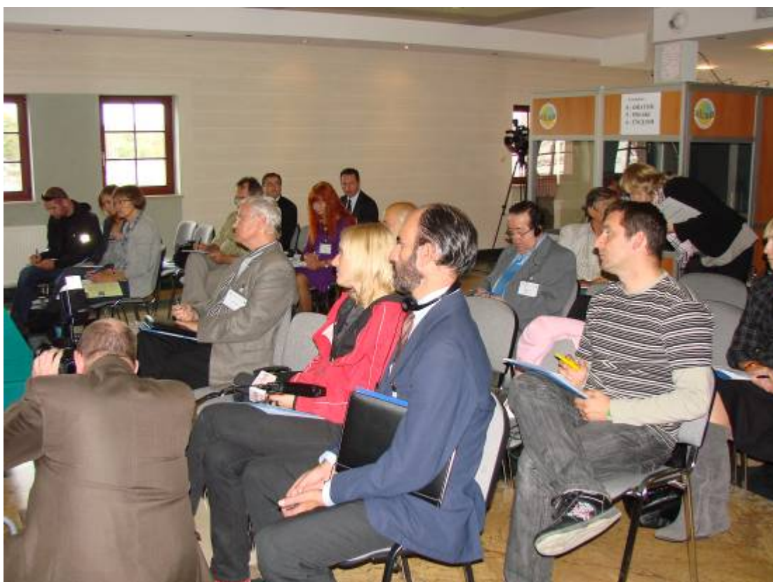
Press conference - Journalists