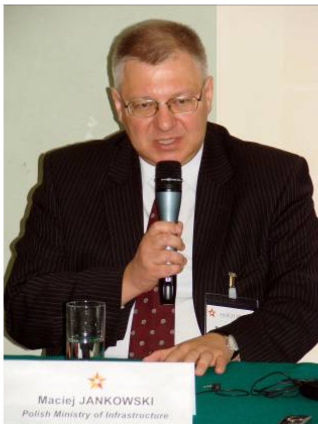
Maciej Jankowski , Undersecretary of State at the Polish Ministry of Infrastructure