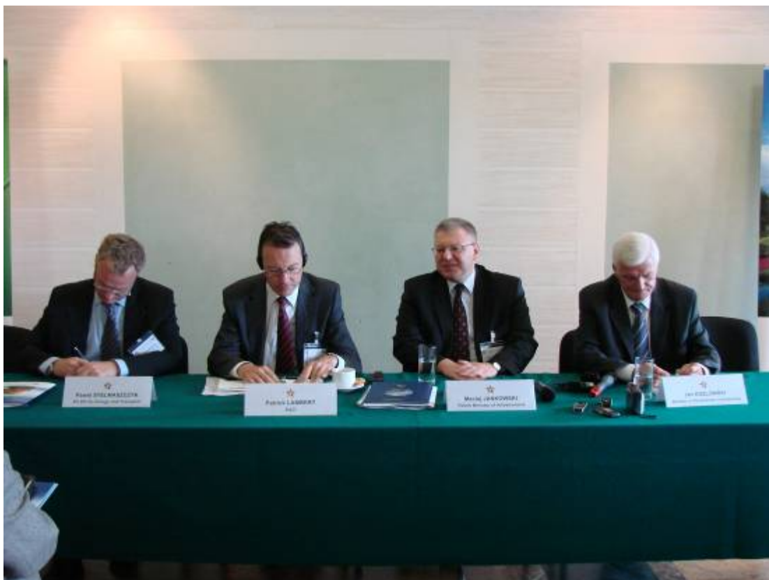
Press conference – Speakers' table