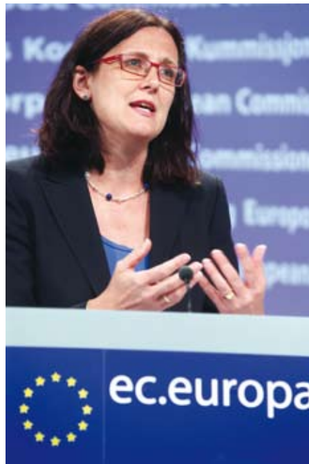
Cecilia Malmström, comisar european pentru Afaceri Interne

De altfel, Transparency International, una dintre vocile importante ale societății civile, consideră că, pe termen lung, dacă