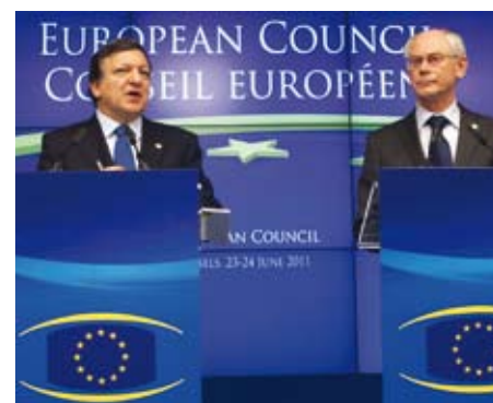
José Manuel Barroso, președintele Comisiei Europene, și Herman van Rompuy, președintele Consiliului European

Noile reguli și evaluări privind primirea în spațiul de liberă circulație a statelor candidate nu sunt aplicabile României și Bulgariei. Chiar dacă acest lucru nu este explicit menționat în concluziile summit-ului, după cum a declarat președintele Traian Băsescu la