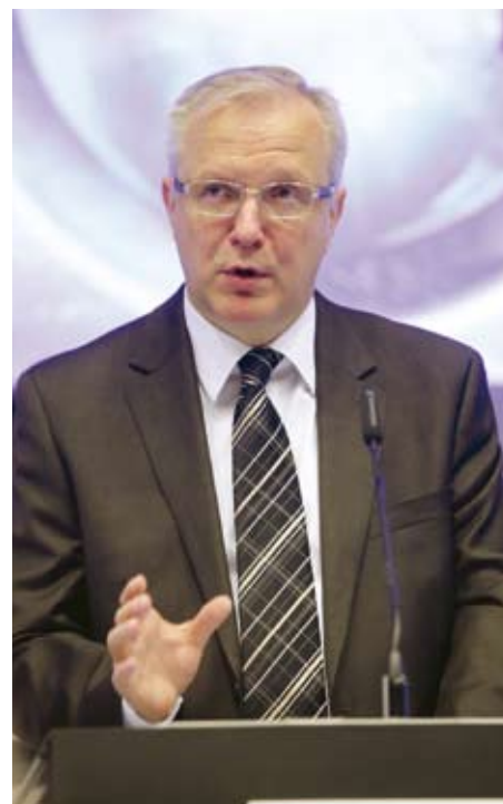
Olli Rehn, comisar european pentru Afaceri Economice și Monetare

În cazul României, Comisia consideră că Programul Național de Reformă și Programul de Convergență, trimise de guvern la începutul lunii mai, includ estimări macroeconomice plauzibile. Comisia Europeană remarcă, totuși, că ar putea fi nevoie de noi măsuri, pe lângă cele deja anunțate, pentru a ajunge, anul viitor, la un deficit de sub 3 la sută din Produsul Intern Brut. Principalul risc, avertizează CE,