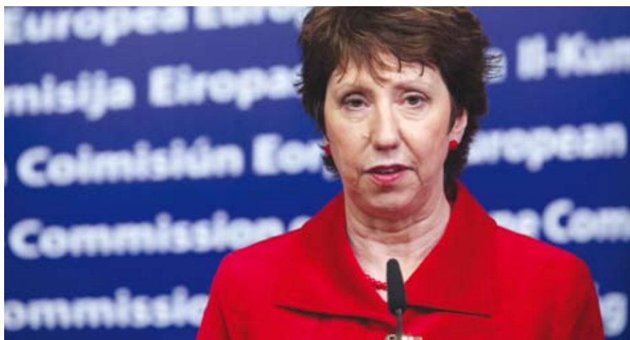
Catherine Ashton, Înaltul reprezentant al Uniunii Europene pentru afaceri externe și politica de securitate

Nu ne-am așteptat ca procesul să fie rapid sau ușor. Rănile istoriei au nevoie de timp să se vindece. Există multe situații care încă