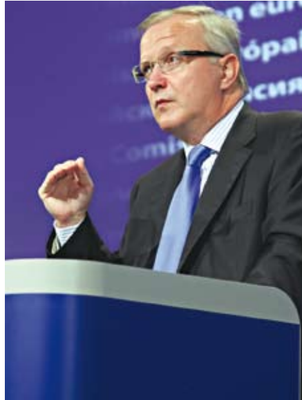
Comisarul european pentru afaceri economice și monetare, Olli Rehn

José Manuel BARROSO, președintele Comisiei Europene, a argumentat: "Sigur că pe