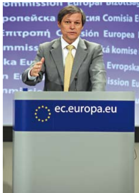
Comisarul european pentru agricultură, Dacian Cioloș

Comisia va cere Consiliului și Parlamentului European să adopte propunerea, printr-o procedură legislativă accelerată, până la sfârșitul