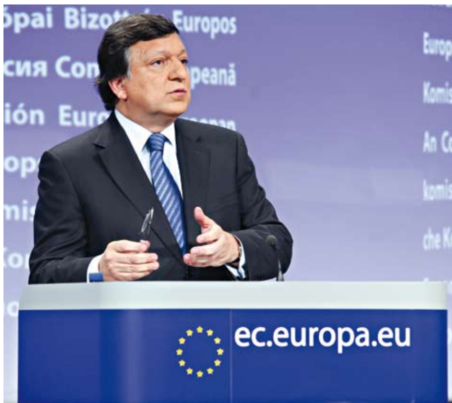
Președintele Comisiei Europene, José Manuel Barroso

Președintele Comisiei Europene, José Manuel Barroso, a declarat: „Aceste propuneri constituie un răspuns excepțional la circumstanțe excepționale. Accelerarea utilizării acestor fonduri, împreună cu programele de asistență financiară, demonstrează angajamentul Comisiei de a impulsiona prosperitatea și competitivitatea țărilor cel mai grav afectate în urma crizei financiare – contribuind în acest mod la un fel de „Plan Marshall” pentru redresarea economică. Această decizie va injecta fonduri esențiale în economiile naționale, reducând necesitatea de cofinanțare din bugetele naționale a