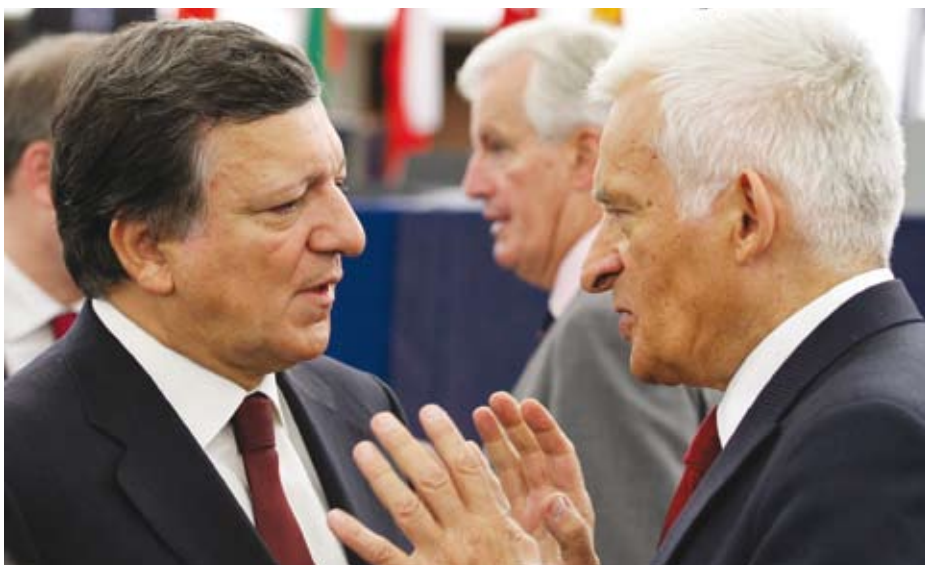
Președintele Comisiei Europene, José Manuel Barroso (stânga), și președintele Parlamentului European, Jerzy Buzek

Oficialul european a recunoscut că unul dintre motivele care au dus la actuala criză