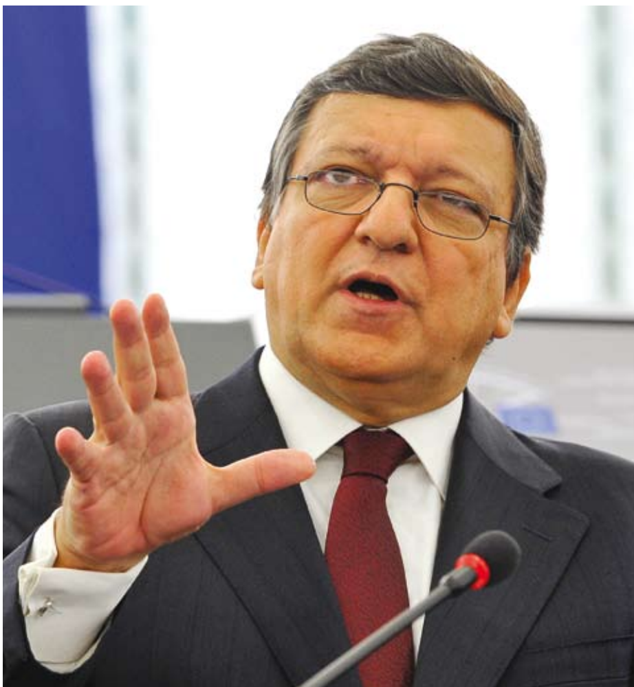
Președintele Comisiei Europene, José Manuel Barroso