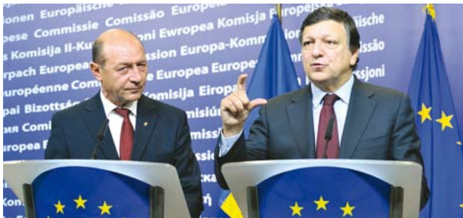
Președintele Traian Băsescu și președintele Comisiei Europene José Manuel Barroso

Concret asistența tehnică înseamnă că, în curând, Comisia Europeană va trimite în România experți care să ajute autoritățile în procesul de atragere a fondurilor europene. A fost un acord de principiu, detaliile vor fi stabilite mai târziu."