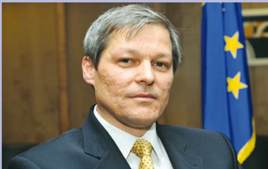
Dacian Cioloș, comisarul pentru Agricultură și Dezvoltare Rurală

Comisia Europeană a lansat oficial propunerile privind noua Politică Agricolă Comună (PAC), care ar trebui să intre în vigoare în 2014. Potrivit proiectului, subvențiile pentru fermieri, 280 de miliarde de euro pentru șapte ani, vor fi echilibrat distribuite între estul și vestul Europei. Subvențiile pentru fermele mari ar urma să fie plafonate. Vor fi sprijiniți micii fermieri, fermierii tineri, cei care se asociază precum și cei care vor aplica standarde ecologice. Comisarul pentru Agricultură și Dezvoltare Rurală, Dacian Cioloș, detaliază pentru cititorii noștri principalele propuneri pentru noua PAC și modul în care acestea vor afecta România.