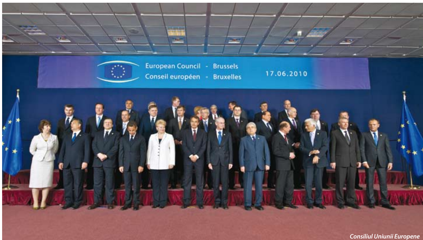
Consiliul Uniunii Europene