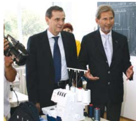
Comisarul european Johannes Hahn (dreapta), în vizită la o școală pentru copii cu dizabilități

Inițiat de România și Austria în 2008, acest ambițios proiect european de cooperare macro-regională a trecut cu succes de faza consultării publice, în prima parte a acestui an, și va fi demarat cel mai probabil în prima parte a anului 2011, în intervalul de 6 luni în care Ungaria va deține președinția rotativă a UE. Comisarul Johannes Hahn s-a arătat extrem de încântat de interesul ma-