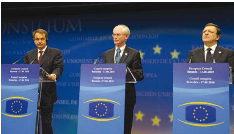
José Luis Rodríguez Zapatero (prim-ministrul Spaniei, reprezentând președinția UE), Herman Van Rompuy (președintele Consiliului European) și José Manuel Barroso (președintele Comisiei Europene)

Consiliul European de vară – desfășurat doar o zi, în loc de două, ca de obicei – a fost fără surprize: cei 27 de șefi de stat și de guvern s-au înțeles asupra tuturor punctelor de pe agendă, iar reuniunea s-a terminat la timp, fără a se intra în tradiționalele prelungiri. De altfel, presa și comentarii politici au spus despre actualul Consiliu de vară că a fost un binevenit moment de calm după atâtea reuniuni de urgență, tensiuni și crize.