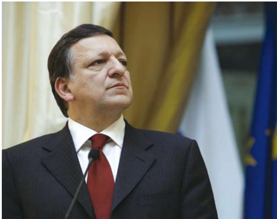
Președintele Comisiei Europene, Jose Manuel Durao Barroso

Cu o întârziere de câteva luni, la Bruxelles s-a instalat, în sfârșit, noua Comisie Europeană. Colegiul propus de Jose Manuel Barroso – aflat la al doilea mandat la șefia Comisiei – a trecut fără emoții de votul din Parlamentul European, la 9 februarie. Este primul executiv comunitar care funcționează potrivit Tratatului de la Lisabona, cea mai notabilă schimbare fiind aceea că din Comisie face parte (e chiar unul dintre vicepreședinți) și Înaltul Reprezentant al Uniunii pentru afaceri externe și politica de securitate, «ministrul de externe» al Europei, cum îl numește presa. Când și-a prezentat echipa, în plenul Parlamentului European, președintele Jose Manuel Barroso le-a spus deputaților că au în față oameni cu idei noi, dar și cu experiență, gata să-și asume sarcini dificile, în aceste vremuri neobișnuit de grele, dacă ar fi să ne gândim doar la efectele crizei economice sau la lupta cu schimbările climatice.